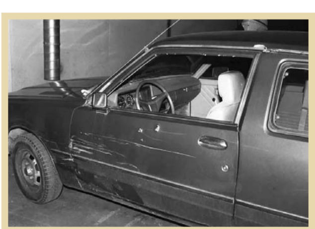
پوسپیل حمل کاظم رجوی هنگام ترور وی

«پس از انتشار خبر دستگیری شه‌ریور ۱۳۵۰ مسعود رجوی در داخل کشور در آبان‌ماه از نمایندگی ساواک در سوئیس خواسته می‌شود، با توجه به اینکه مسعود از اعضای فعال گروه بوده و در دادگاه به مجازات محکوم خواهد شد، سریعاً با برادر وی تماس و ضمن توجه وی یادآوری می‌شود، از هر گونه اقدام جنجالی خودداری و چنانچه به منظور ملاقات با برادرش مایل است به کشور مسافرت کند، تسهیلات لازم جهت وی فراهم شود. کاظم رجوی علاوه بر تعامل با ساواک با توجه به اینکه در ظاهر جزو نیروهای مخالف شاه است، به طور موازی فضاسازی مطبوعاتی