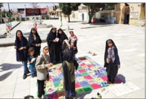
جهادگران برای مردمی کردن اقتصاد، مأموریت جدیدی را تعریف کرده و وارد میدان شده‌اند.