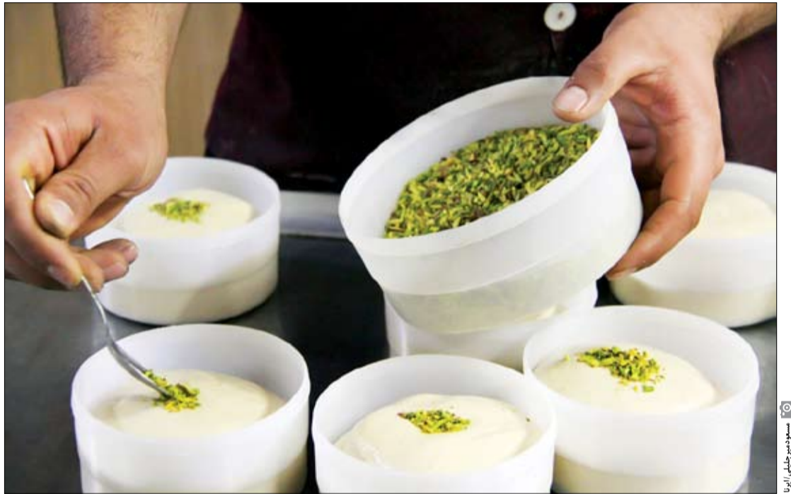
سوسومر عطایی، اردکان

تبدیل شده است. با اینکه تولید ارده در اردکان به چند قرن پیش برمی‌گردد اما برنامهریزی‌های بسیج سازندگی و حمایت‌های این نیرو از فعالان تولید ارده و فرآورده‌های آن موجب شده است امروز نه تنها همه شهرهای ایران به مشتری اردکانی‌ها تبدیل شوند بلکه تولیدات این شهر آماده صادرات و رسیدن به بازار دیگر کشورها باشند.