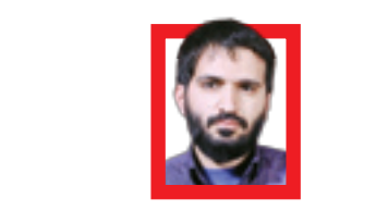
کارشناس ارشد حوزه مالیاتی