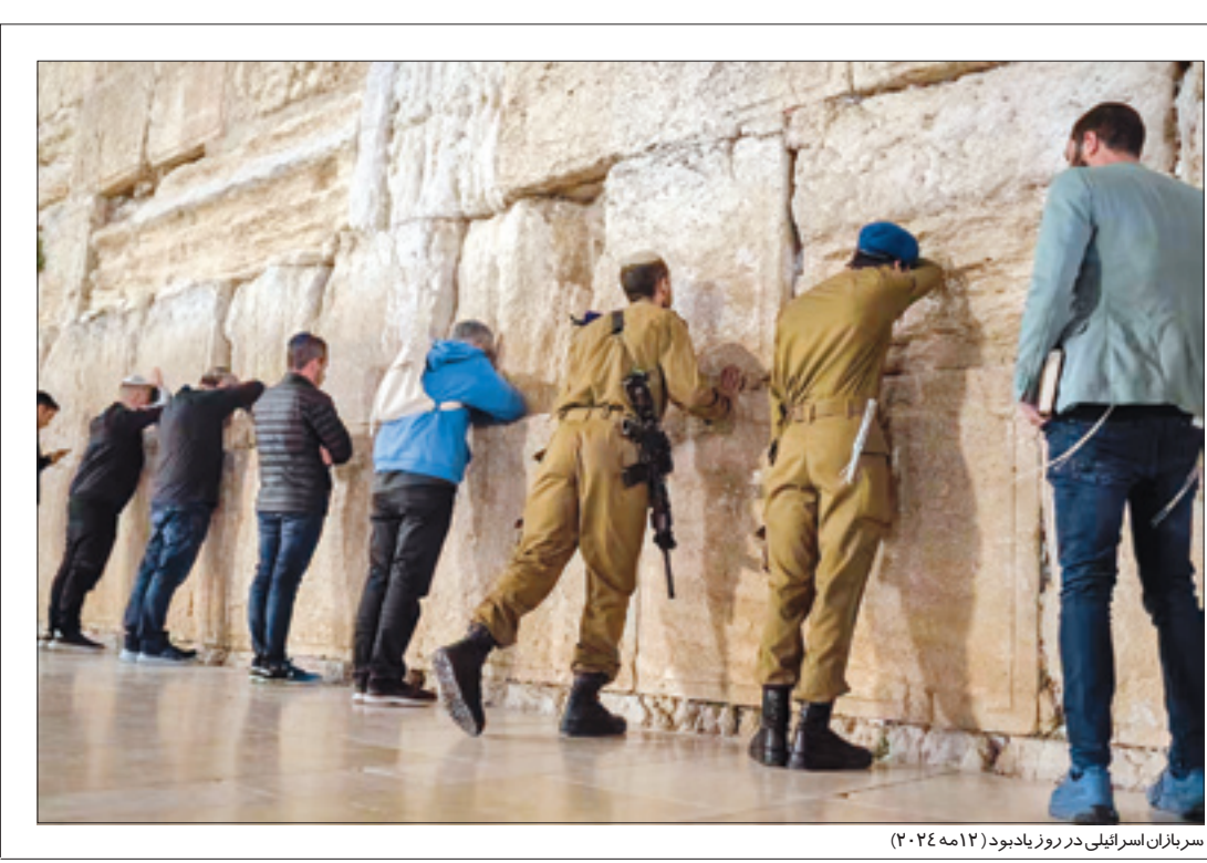
سربازان اسرائیلی در روز یادبود (۱۲ مه ۲۰۲۴)

سید حسن نصرالله: در اسرائیل بر شکست اجماع نظر وجود دارد