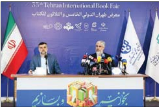
رئیس سفارت ایران

افزایش حضور ناشران تا بر خورد با پخته‌خوارها برنامه‌هایی هستند که در جریان نشست خبری سی و پنجمین نمایشگاه بین‌المللی کتاب تهران وعده داده شد