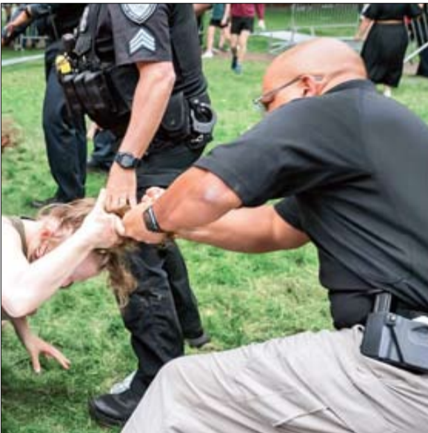
یک دانشیار جامعه‌شناس را با سر به زمین می‌زنند تا پیشانی‌اش خونی شود و موهای یک دختر دانشجو را چنان می‌کشند تا از سر او کنده شود که چرا معترض کشتن کودکان فلسطینی شده‌اید