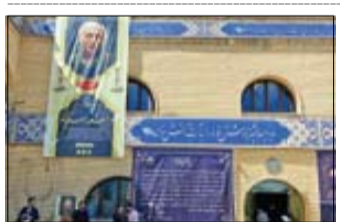
در مسجد بلال انجام شد

فیلم‌های سینمایی «تگزاس ۳» و «عطر آلود» از دوم خرداد ماه روی پرده سینماهای سراسر کشور می‌روند. پنجمین جلسه شورای صنفی نمایش، روز گذشته یکشنبه ۱۶ اردیبهشت‌ماه در خانه سینما برگزار شد. شورا بعد از بررسی درخواست‌ها و موارد مطرح شده، قرار داد دو فیلم تگزاس ۳ کارگردانی مسعود اطیابی و تهیه‌کنندگی ابراهیم عامریان به سرگروهی پردیس سینمایی هویزه مشهد و فیلم سینمایی عطر آلود به کارگردانی هادی مقدم‌دوست و تهیه‌کنندگی یوسف منصوروی با پیش‌بهن سبز به سرگروهی پردیس سینمایی هنر شهر آفتاب شیراز بعد از فیلم «تاوان» را به ثبت رساند. همچنین مقرر شد اکثر فیلم‌سینمایی تگزاس ۳ چهارشنبه، دوم خردادماه در سینماهای سراسر کشور آغاز شود.