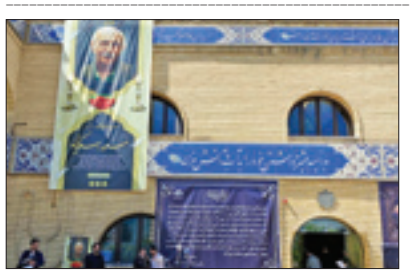
در مسجد بلال انجام شد