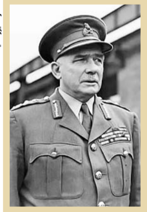
محمود رضا پهلوی

«پس از رسوایی طرح قرارداد ۱۹۱۹، غلیبان احساسات ناسیونالیستی در ایران اوج گرفت. با اینکه انگلستان تنها قدرت خارجی مستقر در ایران به شمار می‌رفت و به‌ظاهر رقیبی در برابر خود نمی‌دید، اما ارائه سناریوهای گوناگون که از تجزیه ایران، انتقال پایتخت و حتی به سلطنت رساندن یکی از اعضای جوان قزاق هم سخن می‌گفتند، مانع از اتخاذ یک تصمیم قطعی درباره وضعیت ایران شده بود. در این بین سناریوی ایجاد یک دولت مرکزی قدرتمند، همچنان از سوی آبرونساید مطرح می‌شد. او به شدت معتقد بود که یک حکومت قدرتمند که از راه کودتا به قدرت رسیده باشد، بهترین راه تأمین منافع انگلیس می‌باشد. در میان سیاستمداران کهنه‌کار حاضر در عرصه سیاسی انگلستان اما نظر مثبتی نسبت به رضاخان وجود داشت. نخستین دلیل این امر، توانایی نظامی رضاخان و پشتیبانی او از منافع انگلستان بود. تورنم درباره او گفته بود: مطمئناً ورواست‌ترین رئیس‌الوزرای است که تاکنون در اینجا با آنها سروکار داشته‌ایم و بیش از پیشبینان خود به دست ما هدایت می‌شود. البته این شایستگی‌های نظامی رضاخان و ویژگی‌های شخصیتی او نبود که توجه انگلیسی‌ها را جلب می‌کرد. به نظر می‌رسید که سایر گزینه‌های انگلیس برای تشکیل دولت، در جریان قرارداد ۱۹۱۹ بی‌اعتبار شده بودند. تا جایی که از سید ضیاء یکی از معروف‌ترین رجال انگلوفیل، به‌عنوان سیاستمداری شایان، انگلیس پرست و رسوا یاد می‌کردند. به‌علاوه، رضاخان، مردی بدون وابستگی طبقاتی به ایلات و زمین‌داران حاکم بود و می‌توانست هم‌توجه نیروهای جدید را – که در نتیجه تحولات مشروطه به وجود آمده بودند – جلب کند و هم‌این توانایی را