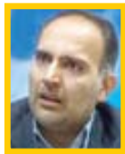
سیدمجید امامی دبیر شورای فرهنگ عمومی کشور

درباره چالش‌های پیش‌رو در سالی که به نام جهش تولید با مشارکت مردم نامگذاری شده، باید بگوییم که در جلسه اخیر شورای فرهنگ عمومی، منشور سال و منویات رهبری نسبت با مسائل کلان اقتصادی و فرهنگی ایران مورد تحلیل قرار گرفت و در چهار عرصه مهم نسبت شعار سال با نظام فرهنگ عمومی کشور تبیین شد که یکی از این عرصه‌ها حوزه پیوست فرهنگی جهش تولید است.