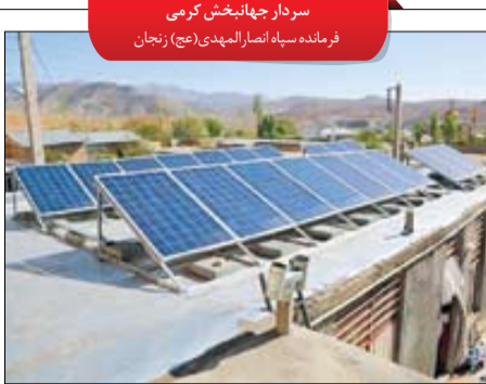
سردار جهانبخش کرمی فرمانده سپاه انصارالمهدی (عج) زنجان

توجه به موضوع انرژی و کمک برای استفاده از انرژی‌های پاک در استان زنجان در دستور کار قرار دارد که بر همین اساس در سال گذشته ۱۸۵ نیروگاه خورشیدی در این استان مورد بهره‌برداری قرار گرفت و ۳۵۵ نیروگاه خورشیدی نیز در دست اقدام است. در سیج سازندگی فعالیت‌ها در قالب چهار قرارگاه اقتصاد مقاومتی، محرومیت‌زدایی، قرارگاه جهادی و خدمات‌رسانی انجام می‌شود.