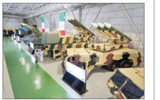
راهیان پیشرفت و بازدید از افتخارات سپاه در عرصه هوافضا