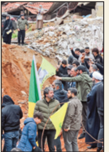
▲ اسفند ۱۴۰۳. اجتماع مردم ضاحیه بیروت در محل شهادت سیدحسن نصرالله

رنامای ناشر در ایضاحی پیرامون موضوع کتاب به نکات ذیل اشارت برده است: «کتاب عربیکا به قلم وحید یامین‌پور – که از سوی انتشارات سوره مهر روانه بازار شده است- روایتگر سفری پرماجر با به لبنان و تجربه‌های نویسنده از دل جنگ و بحران‌های این کشور است. یامین‌پور در این اثر با توصیف حال و هوای کشور لبنان و مردم مقلاوم آن تصویری زنده و تأثیرگذار از زندگی و ایستادگی در شرایط سخت ارائه می‌دهد. عربیکای راوی ما بین اولین سفرن نویسنده به گزونه‌ای به ترسیم بحران‌ها و رشادت‌های مردم سفرش در سال ۲۰۰۴ و پس از شهادت سیدمقاومت است. یامین‌پور در این کتاب دیدار خود با سیدحسن نصرالله را که در سال ۲۰۰۳ انجام شده است، روایت کرده و همچنین به سفرش پس از طوفان‌الاقصی در همان سال پرداخته است. علاوه بر آن، عربیکا با نگاهی تاریخی به مقاومت فلسطین و مسئله صهیونیسم به معرفی چهره‌های شاخص جبهه مقاومت نیز می‌پردازد. در بخش‌هایی از این سفرنامه، تجربه‌های نویسنده در مواجهه با بمباران‌ها شهادت‌ها و شرایط نابه‌سامان لبنان به‌ویژه پس از شهادت سیدحسن نصرالله با نثری تأثیرگذار روایت شده است. این اثر با جزئیات دقیق، به گونه‌ای به ترسیم بحران‌ها و رشادت‌های مردم لبنان می‌پردازد که مخاطب را با واقعیت‌های ملموس این مقاومت آشنا می‌کند. یکی از ویژگی‌های برجسته این کتاب جنبه آموزشی آن است. عربیکا برای کسانی