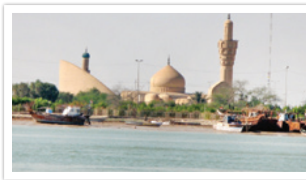
مسجد فاو به شکل کشتی به گل نشسته از محل یادمان والفجر ۸ مشخص است

و در مسیر رفتن به سمت خرمشهر، از پل نور شد و نهایتاً به دروازه‌های شهر رسید. بنابراین حتی مسیر حرکت از خرمشهر به شلمچه نیز مشهد شهدای بسیاری است. در عملیات فتح خرمشهر (السی بیت‌المقدس) رزمندگان با دور زدن خرمشهر، ابتدا خود را به شلمچه رساندند تا نیروهای دشمن در داخل شهر را به محاصره در آورند. در بخش اعظمی از اردیبهشت سال ۶۱ در منطقه شلمچه شهدای بسیاری تقدیم شد. سپس در عملیات رمضان از شلمچه گرفته تا پاسگاه زید از محورهای عملیاتی بودند. در زمستان سال ۶۵ و در جریان عملیات کربلای ۵، نیز باز در شلمچه وارد عمل شدیم و نهایتاً باید گفت خاک‌های شلمچه بیشتر از هر نقطه دیگری خون پاک شهدا را به خود دیده است.