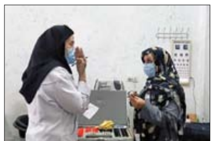
خدمات رسانی جهادگران در ایام نوروز