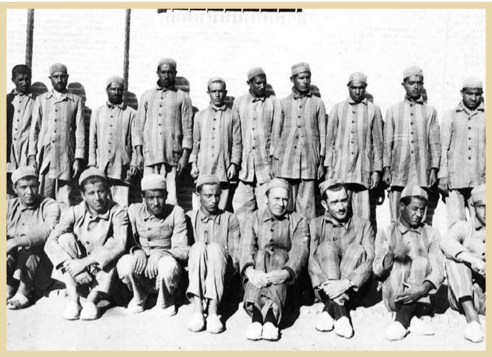
جمعی از زندانیان در یکی از محبس‌های رضاخان

امروزه رسانه‌های جفت و طاق اسرائیلی/انگلیسی/امریکایی، در بیلان دهی از کارگرد رضاخان از سرپاس مختاری‌ها، پزشک احمدی‌ها و نظایر آنان نمی‌گویند، چه اینکه سبعبیت و توحش قزاق در مقام حکومت داری را عیان می‌سازد. با این همه دنیای امروز دنیای تسهیل‌ار تباطات است. آنان هر قدر نیز در اغواگری و وسایل ایجاد آن دست بالا داشته باشند، نمی‌توانند حقیقت را برای همیشه پنهان دارند. بیداری سر نوشت محتوم انسان جست‌وجوگر است