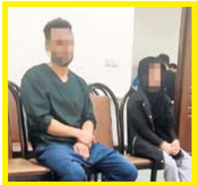
زن و مرد خیانتکار در قهوه‌خانه به دام افتادند