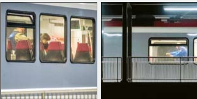
سفر به ترکیه