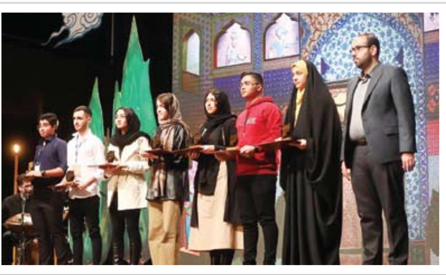
روایتی از رویداد

و استعدادیابی، به حوزه هنری دعوت شدند و از ۱۶ تا ۱۹ اسفندماه به مدت چهار روز، مهمان حوزه هنری بودند. در این چهار روز، گندهمایی با سر فصل‌های قهرمان روایتگری در هنر، فرم یا محتوا… و برگزار شد و برگزیدگان بر ایده‌بعدی خود با موضوع «روایت قهرمانان پیشرفت»، متمرکز شدند و روی آثار بعدی شان کار کردند تا هر کدام در شاخه هنری مربوط به خود به ایده جدید دست یابند. شرکت کنندگان این رویداد پس از کامل کردن ایده‌های خود طی این چهار روز، به ایده نهایی رسیدند و پس از جمع بندی، هیئت داوران متشکل از مربی‌ها و کارشناسان موضوعات هنری، به آثار هنری اعتباری می‌بخشند و آثار معتبر به مرحله اجرا و تولید وارد می‌شوند.