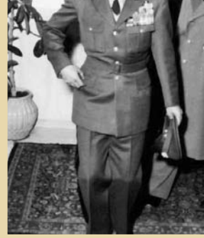
فضل‌الله زاهدی در کنار محمدرضا پهلوی، در یکی از بازدیدها

«شاه یک عدم اعتمادی نسبت به رجالی که با ایشان کار می‌کردند، داشتند که شاید ریشه تاریخی داشت و ریشه‌های این بی‌اعتمادی، در وقایع دهه‌های قبل نهفته بود. لذا به سخنان و نظرات و پیشنهادات همکاران زندگیشان، خیلی با دید شک و تردید نگاه می‌کردند و بعضی وقت‌ها هم با ظن قوی، یعنی نمی‌خواستند که کسی در زمینهای یا در قسمتی از کارها آنچنان قدرت پیدا کند که بتواند خود تصمیمات لازم را بگیرد و به اجرا گذارد و عملی کند. به این جهت بود که سعی می‌کردند به هر