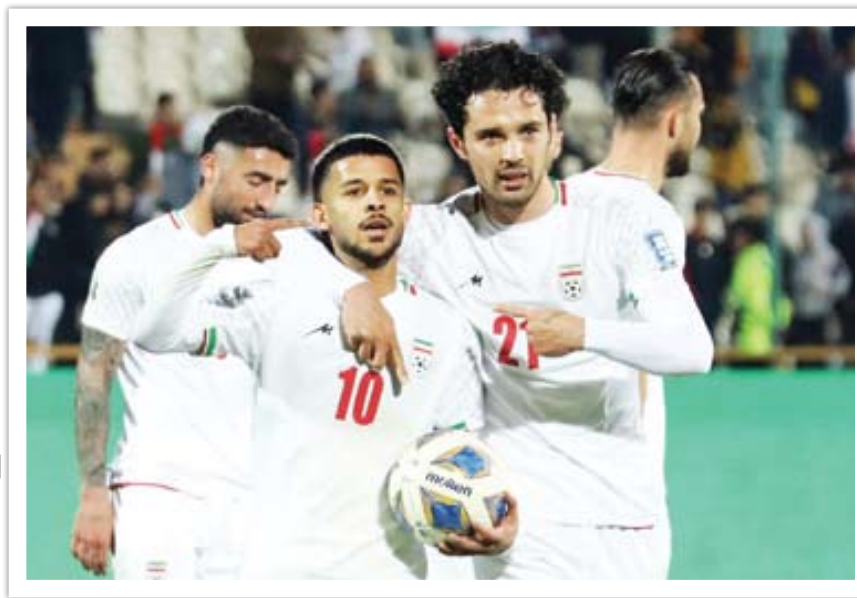
میدان فوتبال جوانان

همه می‌دانند یا این تیم به جایی نمی‌رسیم. قبلاً هم گفتم هر کسی بالاتر تیم‌ملی باشد، باز هم حتماً به جام جهانی صعود خواهیم کرد، ولی با سه باخت کارمان در جام جهانی تمام خواهد شد! درست مثل سه دوره گذشته. برای موفقیت و پیشرفت نباید به جام جهانی، جام‌ملت‌ها و حتی لیگ‌های جوانان توجه کرد. باید دید چه زمینه‌ها شکست‌خورده و یک بازنده هستیم. همه بازیکنانی که در تیم‌ملی حضور داشتند، تفکر بازنده دارند و انگیزه و اعتمادبه‌نفس لازم را