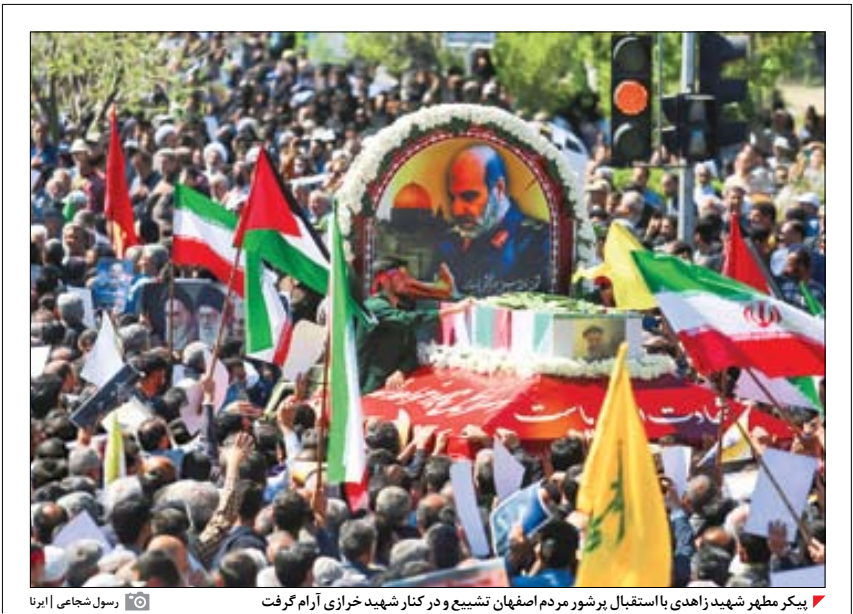
پیکر مطهر شهید زاهدی با استقبال تشییع و در کنار شهید خرازی آرام گرفت

امریکا مسئول اصلی جنایت رژیم صهیونیستی در دمشق است