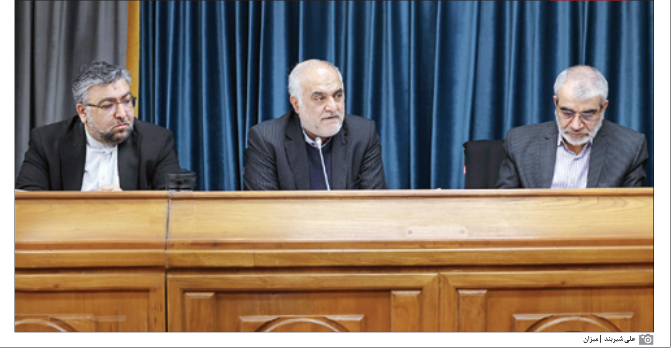
علی شهبودن امینان

مدیرکل شورای عالی امور ایرانیان خارج از کشور: