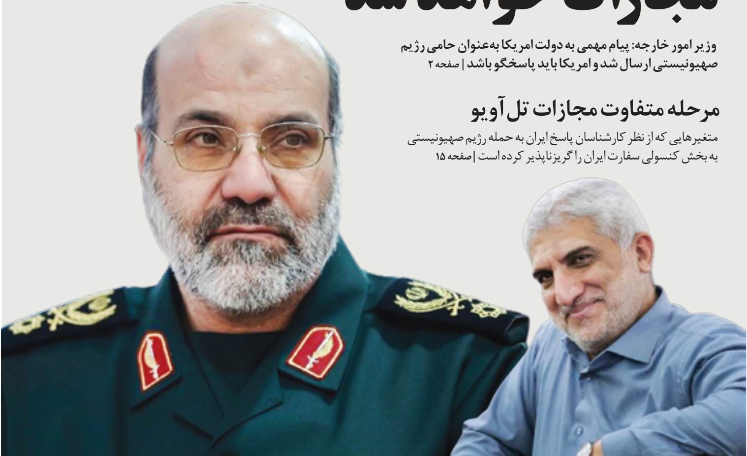
ناظران بین‌المللی احتمال مرحله جدید انتقام‌گیری از رژیم صهیونیستی را پس از حمله به کنسولگری ایران در دمشق بسیار محتمل می‌دانند

متغیرهایی که از نظر شناسان پاسخ ایران به حمله رژیم صهیونیستی به بخش کنسولی سفارت ایران را گریزناپذیر کرده است | صفحه ۱۵