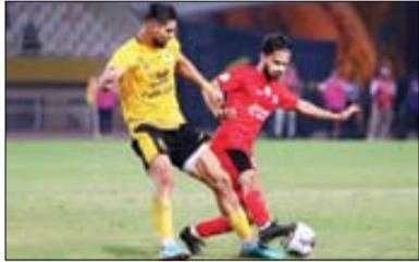
جدال عقب افتاده تراکتورسازی - سپاهان