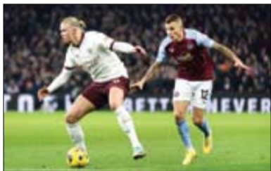
گواردیولا همچنان به قهرمانی سیتی می اندیشد