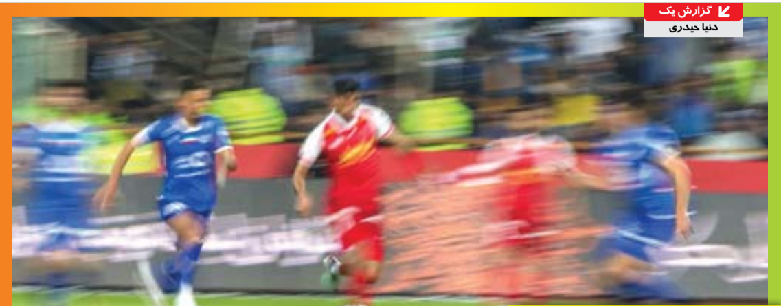
گل بود به سبزه هم آراسته شد