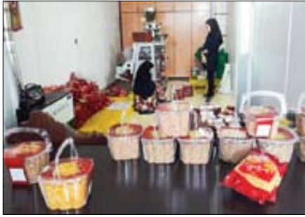
▲ اقتصاد مقاومتی موجب اشتغال‌زایی برای زنان سر پرست خانواده می‌شود