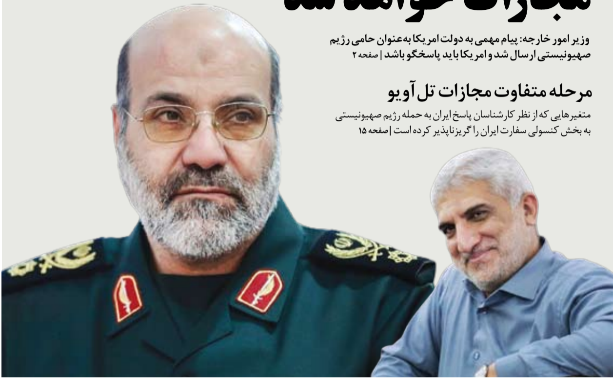
ناظران بین‌المللی احتمال مرحله جدید انتقام‌گیری از رژیم صهیونیستی را پس از حمله به کنسولگری ایران در دمشق بسیار محتمل می‌دانند

متغیرهایی که از نظر کارشناسان پاسخ ایران به حمله رژیم صهیونیستی به بخش کنسولی سفارت ایران را گریزناپذیر کرده است | صفحه ۱۵