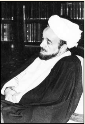
✓ زنده یاد علامه محمد تقی جعفری تبریزی

«علامه محمدتقی جعفری یکی از اندیشمندان، فلاسفه و عرفای معاصر اسلامی و ایرانی است که طی نیم قرن اخیر، تلاش‌های علمی و دیدگاه‌های مختلف ایشان، آشنای اهل معرفت بوده است. از آنجایی که علامه در حوزه‌های مختلف علمی و معرفتی صاحبنظر بوده و آثار قابل تحسینی نیز از خود به جای گذارده‌اند، لذا افراد بسیاری نیز (به خصوص بعد از درگذشت ایشان)، به تبیین و تشریح نظرات عرفانی، فلسفی، فقهی و... ایشان پرداخته‌اند. این تحقیق نیز در حد توان خود، به تبیین نگاه‌ها و دیدگاه‌های اجتماعی و سیاسی آن بزرگوار می‌پردازد. شایان ذکر است که محور بحث این تحقیق بر اساس دو سؤال مطرح‌وجه