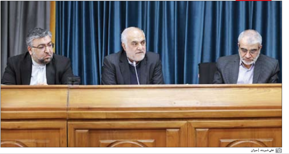
علی عربیند | میوزن

مدیرکل شورای عالی امور ایرانیان خارج از کشور: