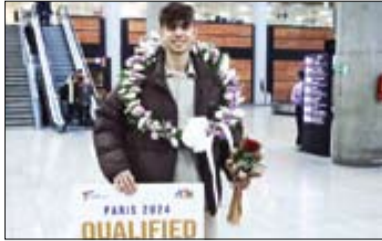
آغاز خوب سال نو برای توکاندو