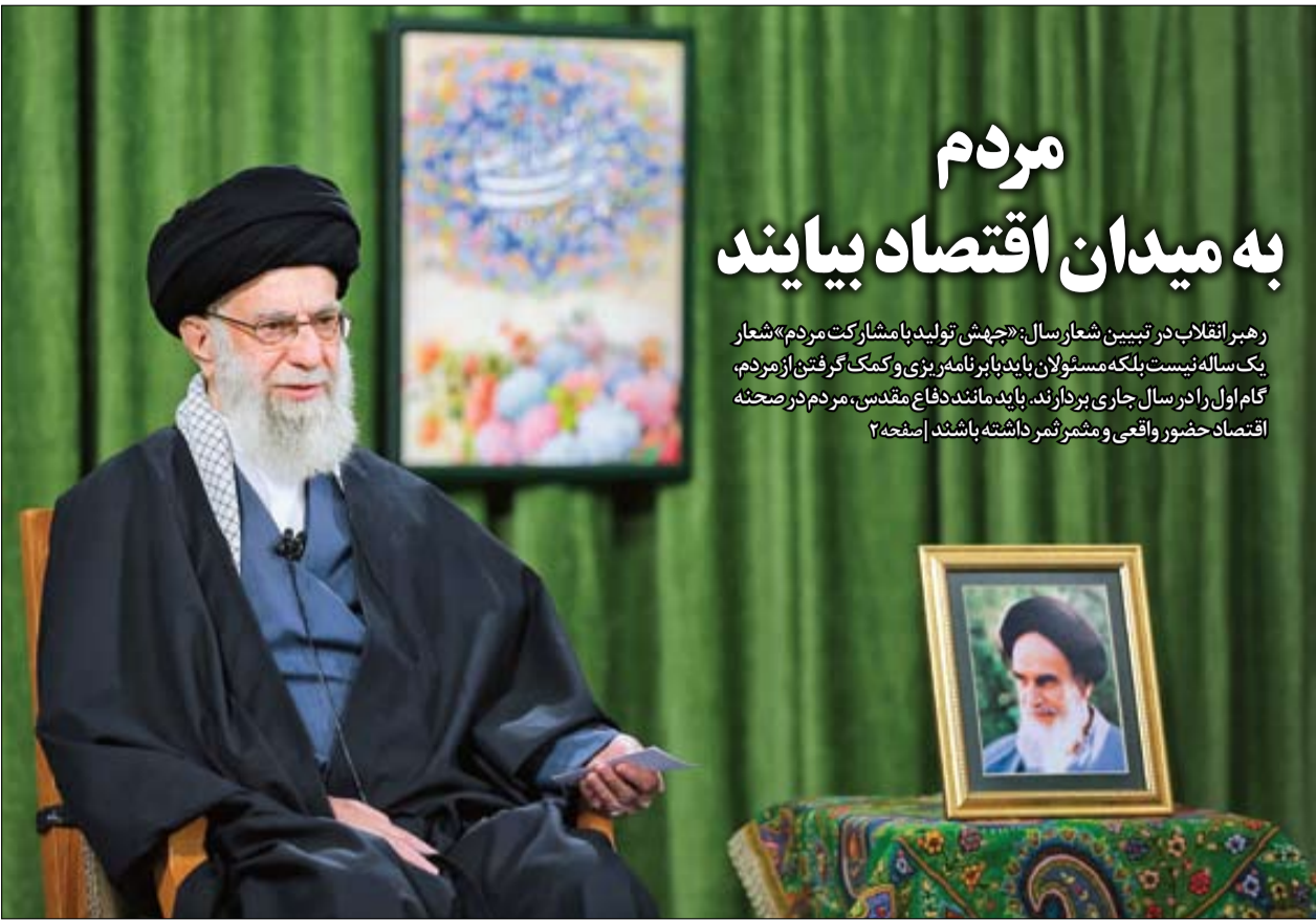
رهبر معظم انقلاب، امسال را نیز با شعار اقتصادی، هدایت کردند. مطابق با این هدایت، اقتصاد باید کاملاً مردمی شود | Khamenei.ir

رهبر انقلاب در تبیین شعار سال: «جهش تولید با مشارکت مردم» شعار یک‌ساله نیست بلکه مسئولان باید با برنامه‌ریزی و کمک گرفتن از مردم، گام اول را در سال جاری بردارند. باید مانند دفاع مقدس، مردم در صحنه اقتصاد حضور واقعی و مشغول‌شمار داشته باشند | صفحه ۲