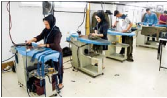
گفت و گو «جوان» با کارآفرین ایلامی