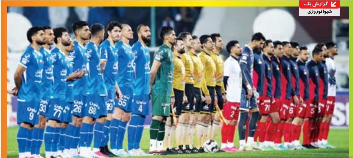
سهام پرسپولیس عرضه شد، اما هیچ خریداری پای معامله نیامد