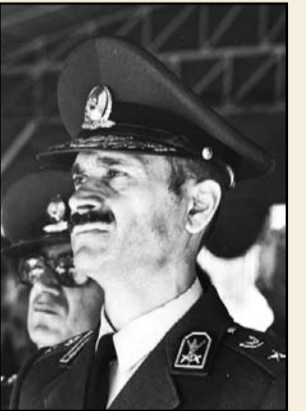
شهید سرلشکر ولی‌الله فلاحی

چراکه می‌دانستند شهادت در این راه، رستگاری برای آنها است. از ویژگی‌های این سلحشوران و سرداران انقلاب، پاک‌ی نیت و عمق خلوص آنها و همچنین همسویی این دلیران با اندیشه‌های امام خمینی است. این همسویی و اطاعت آگاهانه که سبب تأثیر پذیرگی کامل می‌گردد، تا جایی می‌تواند به پیش رود که عوامل تأثیر پذیرنده به عواملی کمالاً تأثیر گذار تبدیل شوند و مانند اجزایی کارساز و فعال، هم‌جهت با انقلاب و هم‌سو با رهبری به یک جریان تبدیل گردیده با به جریان‌سازی در جامعه (به ویژه در نهاده‌ی که در آن خدمت می‌کنند) بپردازند. سرلشکر شهید ولی‌الله فلاحی از جمله افراد تأثیر گذاری بود که در یکی از مقاطع بحرانی و