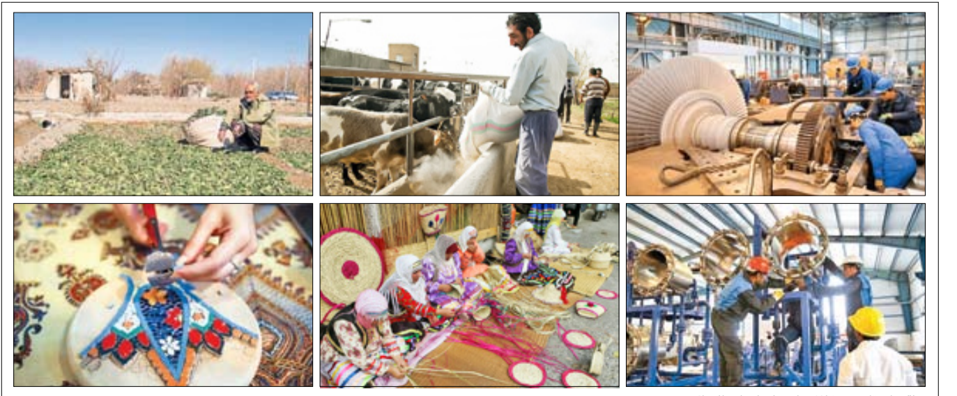
اقتصاد مقاومتی مشاغل زیادی را در استان‌ها احیا کرد

به گفته یکی از کارآفرینان شبستری، طی سال‌های اخیر و با ورود بسیج به حوزه اقتصاد مقاومتی و کمک به کسانی که قصد شروع کاری را داشتند، مشخص شد می‌توان اقدامات ویژه‌ای را رقم زد، به شرطی که از همان ابتدا کسی باید راه را هموار کند و تا پایان به عنوان راهنما حضور داشته باشد، درست مثل تسهیلاتگران بسیجی که در روستاها نکات اصلی حرفه‌ها را به کارآفرینان گوشزد می‌کنند.