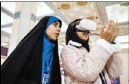
سپهر مهر، تصویر از پیش‌نویس تهران

آنچه مجموعه اوضاع اقتصادی کشور خوب نیست و بهتر است بگویم بد است. بسیاری از وعده‌های اقتصادی دولت‌ها بر زمین می‌ماند و چپ و راست هم ندارد. مردم این روزها در آمد خود را با نرخ افسارگسیخته دلار و سکه می‌سنجند و این یعنی ناامیدی. مطالبه مردم دستاوردهای مرزهای دانش جدید تنها راه ایجاد جامعه سالم و شاد است. اقتصاد سالم و عادلانه، مقدمه خوب‌زیستن، و در جامعه دینی مقدمه معاندان‌پشی است. این واقعیتی است که انقلاب و نظام برخاسته از آن باید خود را در آن موفق نشان دهد تا آن پیروزی‌های ایدئولوژیک جهانی‌اش زیر سایه این اقتصاد ناکارآمد نرود و مهم‌تر از همه اینکه معاندان‌پشی مردم به‌خطر نیفتد.