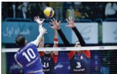
آغاز روزشمار پایان لیگ والیبال

به این ترتیب تیم‌های ملی توکاندوی مردان و زنان ایران با چهار نماینده در المپیک ۲۰۲۴ پاریس به میدان خواهند رفت. هادی ساعی، رئیس فدراسیون توکاندو در خصوص شرایط حضور توکاندوکاران ایران در المپیک می‌گوید: «جوانان بسیار خوبی را در اختیار داریم که توانایی بالایی برای کسب موفقیت دارند، اما شرایط المپیک‌ها متفاوت با رقابت‌های دیگر است که نمی‌توان در مورد نتایج صحبتی کرد، اما با وجود جوانان مستعد و پرتalزی تمام تلاش خود را برای شاد کردن مردم به کار خواهیم گرفت. غیر از ناهید کیانی، سه توکاندوکار دیگر تجربه حضور در المپیک را ندارند، اما در میدان‌های بزرگ به خوبی جواب اعتماد کادرفنی و فدراسیون را داده‌اند.» توکاندوی ایران حالا باید خود را آماده حضور در بزرگ‌ترین آوردگاه ورزش جهان کند، جایی که عیار واقعی توکاندوی ایران مشخص خواهد شد. میدانی که سال‌هاست علاقه‌مندان به توکاندو منتظر درخشش مبارزان ایران در آن هستند.