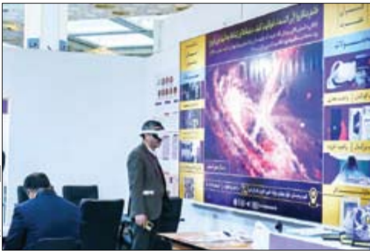
روزنامه صبح ایران