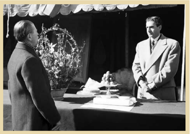
حسین علاء در دوره نخست‌وزیری، در حضور پهلوی دوم سخن می‌گوید