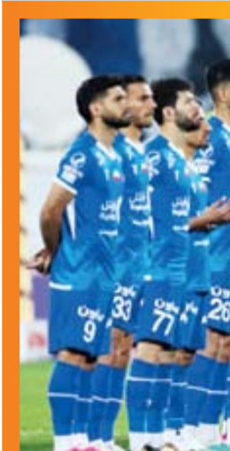
سرمربی ورزشی جوان

معاون توسعه ورزش قهرمانی و حرفه‌ای وزارت ورزش و جوانان هم بار دیگر بر واگذاری هرچه سریع‌تر سرخابی‌ها تأکید کرد. سیدشیرین اسقیان در تازه‌ترین اظهارات خود از تصمیم جدید وزیر ورزش در این خصوص خبر داد: «همانطور که کیومرث هاشمی بارها گفته است، کار وزارت ورزش و جوانان تیمداری