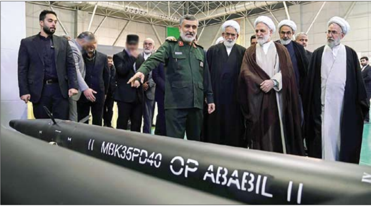
نمایشگاه هوافضای سپاه بیشتر به در باز دید کسانی می‌خورد که معتقدند «نظام دفاعی ایران با یک بمب امریکا نبود می‌شود!» اما دروغ است که آنها اکنون سرگرم انتخابات‌اند تا دوباره فرصت آن‌گونه اظهارات را پیدا کنند! | علی شبریند | امیران

این روزها دریای سرخ به جبهه اصلی تقابل گروه‌های مقاومت علیه رژیم صهیونیستی تبدیل شده است و در تازه‌ترین اقدام انصارالله یمن در حمایت از مردم غزه، سومین کشتی متعلق به اسرائیل را توقیف کرد تا هت‌تریک کرده باشد؛ هشداری جدی به سران تل‌آویو که خنجر یمنی زیر گلوگاه اقتصادی آنها قرار دارد و با تداوم کشتارها در غزه، عاقبت خوشی برای آنها متصور نیست | صفحه ۱۵