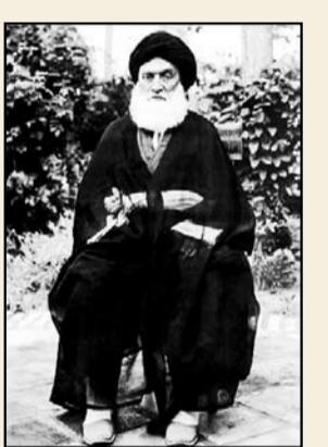
آیت‌الله العظمی سیدحسین طباطبایی بروجردی

نمای ناشر در معرفی این کتاب، به نکات بی‌آمده اشرا ت برده است: «تردیدی نیست که پیروزی انقلاب اسلامی در تاریخ ایران، نقطه عطفی تاریخی محسوب می‌شود. در اینکه این نقطه عطف چگونه به وجود آمد و چه علل و عواملی در ظهور و بروز آن نقش داشتند، سخن فراوان گفته شده است. اما نقش مرجعیت در ایجاد این نقطه و تشکیل جمهوری اسلامی، تعیین‌کننده و منحصر به فرد بوده است. همان‌گونه که نخستین جرقه‌های این انقلاب به دست یک مرجع تقلید زده شد، نیز همو بود که با مقاومت و مجاهدت بی‌ظن بیرش و همراهی یاران وفادار و پشتیبانی‌های مردم، توانست آن جرقه‌ها را به شعله تبدیل کند و آن شعله را درون کاخ ستم و بیداد و استبداد اندازد و آن کاخ و هرچه را در آن بوده را بسوزاند و در نهایت طر حی نو درآندازد و خانهای توبنا سازد و در هدایت و