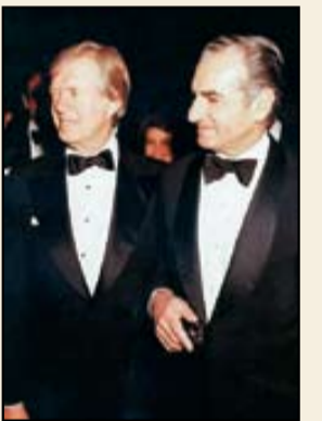
۱۲۵۶،محمدرضای پهلوی در حاشیه دیدار با جیمی کارتر

«بررسی مناسبات دو کشور ایران و امریکا در سال‌های پس از کودتای امریکایی – انگلیسی ۲۸ مرداد ۱۳۳۲، نشان می‌دهد روابط این دو، نمونه‌ای کامل از ارتباطات دولت دست‌نشانده بوده است، به گونه‌ای که شاه ایران اغلب تصمیمات خود را با مشورت امریکایی‌ها اتخاذ می‌کرد و امریکا نیز با حمایت کامل از رژیم شاه، ضمن برآوردن خواسته‌های وی، تمام تلاش خود را جهت حفظ رژیم پهلوی به کار می‌برد. در این دوره امریکایی‌ها در ایران به قدرت کامل دست یافتند، به طوری که طبق نظر آنان، شاه به تأسیس دو حزب مردم و ملیون تن داد تا نشان دهد اصول نظام مشروطه در کشور در حال انجام است، اما این موضوع به خودی خود، نتوانست رضایت دولتمردان امریکا را جلب کند، به طوری که برخی نیروهای امریکایی، سفیر وقت ایران در واشنگتن یعنی دکتر علی امینی را به عنوان