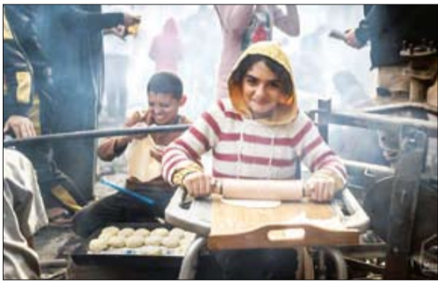
فلسطینیان با کودکانشان به شمال غزه بازگشتند، پیروز مندانه و امیدوار و سازنده

صدها هزار بسیجی در سراسر ایران طوفان «الی بیت المقدس» را بر پا کردند. در تهران ۵۰ هزار بسیجی رزم با رژیم صهیونیستی را به نمایش گذاشتند | صفحه ۲ | محمد مهدی صافی | جوان