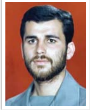
ناصر کاوه در دفاع مقدس