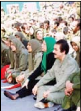
مسعود رجوی و مریم فخر عبدالنلو در جمع اعضای گروهک منافقین

می‌دهد. این پژوهش از سوی مهدی‌حق‌بین تألیف شده و مرکز اسناد انقلاب اسلامی به انتشار آن اهتمام ورزیده است. تارنمای ناشر در ایضاحی پیرامون موضوع این‌ کتاب چنین آورده است: «سازمان مجاهدین خلق ایران (منافقین). نام یک گروه سیاسی - نظامی است که در سال ۱۳۴۴، با هدف سرنگونی رژیم پهلوی تأسیس شد. این سازمان تحت تأثیر سرکوب قیام مردمی ۱۵ خرداد و در جریان تدوین استراتژی خویش به مبارزه مسلحانه رسید و به تدریج با بهره‌گیری از تئوری‌ها و تجارب جریان‌های چپ و مارکسیستی، شیوه جنگ چریکی شهری را اتخاذ کرد. در سال ۱۳۵۰ بنیانگذاران سازمان و به دنبال آن اکثریت کادر آن از سوی ساواک دستگیر و اعدام شدند. با اعدام بنیانگذاران و تعدادی از کادرهای اصلی، سازمان ضربه سختی را متحمل شد تا جایی که در آستانه‌اصحلال قرار گرفت. پس از ضربه شهریور ۵۰میلیون نیروهای مذهبی و اصلی سازمان دستگیر شدند و اعضای دستگیر نشده - که دارای گرایش‌های جدی به مارکسیسم بودند- هدایت سازمان را به دست گرفتند و همین اعضا رسماً تغییراً ایدئولوژی سازمان از اسلام به مارکسیسم را اعلام کردند. این مسئله باعث ایجاد تضادهای جدی میان اعضای مسلمان و مارکسیست شده سازمان شد که در نتیجه به تصفیه و قتل نیروهای مذهبی سازمان از سوی اعضای مارکسیست سازمان منجر شد. این کشاکش تا پیروزی انقلاب اسلامی