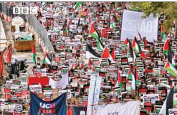
این تصویر بی‌بی‌سی فارسی از تظاهرات چندصد هزار نفری لندن است که بی‌بی‌سی هفت هفته پس از سکوت در مقابل آغاز اولین تظاهرات، تسلیم افکار عمومی و مجبور به انتشار آن شد