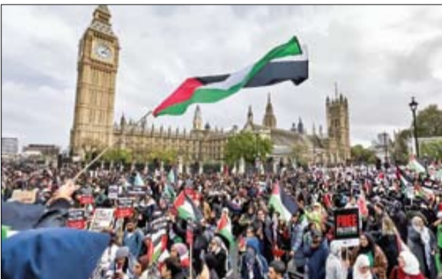
خیابان‌های لندن علیه اسرائیل قفل شد! برای چنین دستاوردی صدسال روشنگری کم بود!

نمی‌آورد و جنایتکار جنگی است و قتل‌عام ددمشمانه می‌کند و مسئله غزه مسئله همه ماست» نشان از شکستی بزرگ و غیرقابل‌ترمیم برای اسرائیل است. حتی شبکه‌های لندن پس از یک‌هفته سکوت مقابل تظاهرات چندصدهزار نفری در لندن زبان به اعتراف گشودند. برخی خبرگزاری‌ها از انهدام ۲۱ تانک، ۲۵ نفر و ۲۲ کشته در حمله زمینی ارتش غاصب به غزه خبر می‌دهند. اسرائیل در حال جان‌کندن مقابل آزادیخواهان جهان است و این سرنوشتی بود که تا سه‌هفته پیش از این تصویری کاملاً وارونه و برعکس از آن برای هویت خود داشت! صفحه ۱۵ را بخوانید