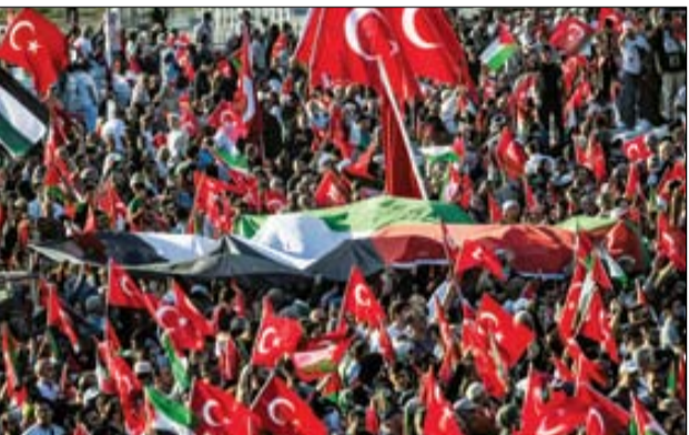
این جمعیت بیکران ضدصهیونیستی در استانبول حتی در وهم و خیال هم تصور کردنی نبود