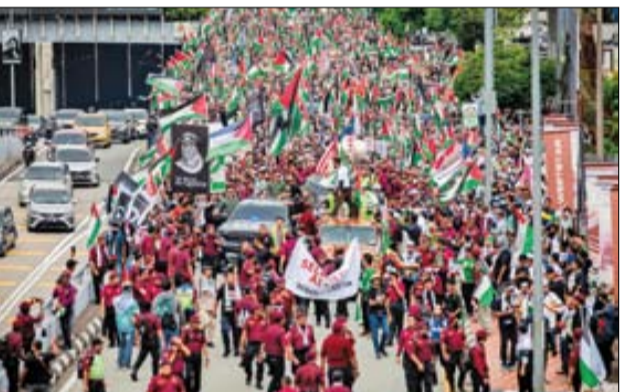
مازی جمعیتی از مردمان را علیه صهیونیسم به خیابان آورد که بی‌تغییر در همه تاریخ این کشور بود