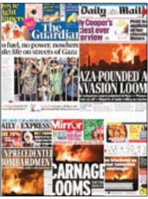
گاردین، دیلی میل، دیلی اکسپرس، دیلی میورر و بقیه روزنامه‌های لندن که آغاز طوفان الاقصی را با ترویج خواندن حماس شروع کردند، حالا مجبور شدند بنویسند: «بی‌عده، بی‌برق، بی‌پناهگاه، هیچ‌جا امن نیست، بمباران و بمباران»