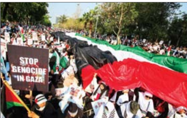
اندونزی بر جمعیت‌ترین کشور مسلمان هم‌تراز جمعیت خود علیه ظلم غاصبان قصاب به پا خاست