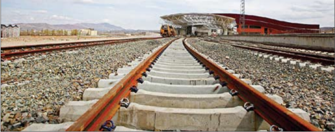
علی حامدحدیوست ایرنا

موقعیت ترانزیتی ایران و اهمیت عبور زمینی کالا در قاره آسیا به می‌گذرد. این مسیرها می‌توانند به هم متصل شوند و برنامه‌های بلندپروازانه‌ای برای اتصال ازبکستان به ایران از طریق افغانستان وجود دارد. علاوه بر این، شبکه ریلی ایران باید از طریق عراق یا ترکیه گسترش یابد تا به درسیا مدیترانه یا اروپا برسد. اگرچه مسیر اتصال عراق هنوز تکمیل نشده است، اما دو مسیر احتمالی از مرز خسروی یا شلمچه به عراق و سپس سوریه و دریای مدیترانه پیشنهاد شده است. ایده تکمیل کریدور مقاومت حول این مفهوم می‌چرخد. از طرف دیگر، ارتباط با اروپا می‌تواند از طریق ترکیه و عراق برقرار شود.