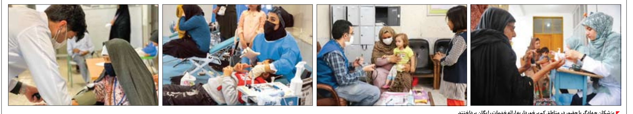
پژشکان جهادگر با حضور در مناطق کم‌برخوردار به ارائه خدمات رایگان پرداختند