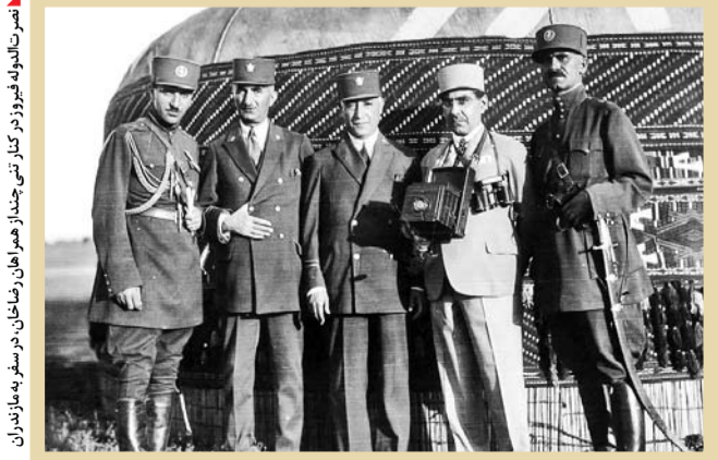
نصرت‌الدوله فیروز در کنار تنی چند از هم‌راهان رضاخان، در سفر به مازندران

«زمین‌های جعفر آباد، حوالی خط آهن به پدرم تعلق داشت. رضاشاه در صد دستبایی به آنها بود. یک روز مظفر نزد من آمد و گفت مریم، شاهزاده نزدیک‌است که برین برون آنها زمین‌ها را می‌گیرند و او بپوهود سرسختی می‌کند… برای چاره‌جویی نزد محتشم‌السلطنه پدرشوهرم رفتم و گفتم خانواده در شرف ازین رفتن هستند! او هم به دیدار فرمانفرما رفت و به او گفته بود که با افتادها می؟ برو و زمین‌ها را ببخش! او هم همین کار را کرد. من متوجه شد به زمین‌های جعفر آباد قانع نیستند. شاه تصمیم گرفته بود که تمام زندگی‌اش را بگیرد. برادرم نصرت‌الدوله در یک سال آخر، جانب احتیاط را از دست داد. منزلش را برای اجاره به یک اروپایی واگذار کرد و با آنها رفت و آمد داشت و همین را مستمسک قرار دادند و به منزلش ریختند. در حین جست‌وجوی آنجا، دو قبضه تفنگ کهنه متعلق به پدرم را پیدا کردند و بر اثر همین جریان او را دستگیر و به سمنان تبعید کردند و سرانجام با آن وضع فجیع او را کشند. شباهت زیادی بین مرگ سیدحسن مدرس و نصرت‌الدوله وجود دارد. همان سالی که مدرس را گرفتند، او را نیز دستگیر کردند و به همان شکلی که سید را کشند، نصرت‌الدوله را هم مسموم کردند. من در محاکمه رکن‌الدین مختاری رئیس شهربانی وقت که بعد از رضاشاه و به درخواست مظفر فیروز (بسر نصرت‌الدوله) صورت گرفته و بسیار جالب برگزار شد، شرکت کرده بودم. وی در اعترافات خود اظهار داشت برای انجام مأموریت به سمنان عزیمت کرده بودیم، یک لیوان آب زهر آلود به او دادم، وقتی که دیدیم هنوز زنده‌است، او را خفه کردیم! درست همان کاری که با مدرس کرده بودند…»