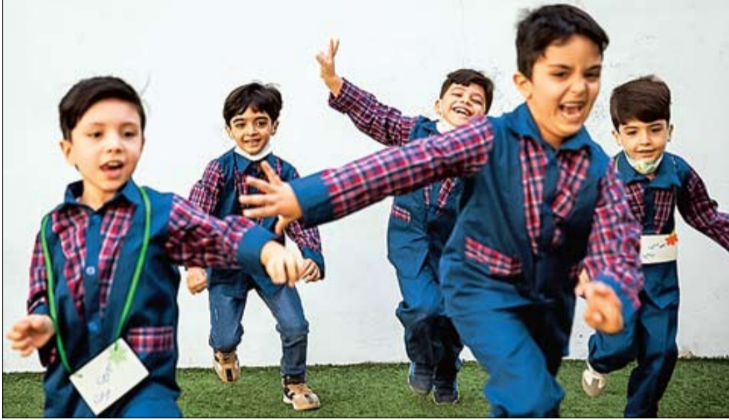
دوره هشتادی‌ها و دهه نودی‌ها هم ساختار گریزند و هم کتاب‌گریز، اما خلایق‌شان آموزش و پرورش را ناچار کرده است. طرحی نو در اندازد. یک طرح خوب قرار است اجرایی شود | صفحه ۲ | ناصر جمعی | آستین

امروز مدارس ابتدایی بدون کیف و کتاب خواهد بود. ایده‌ای که هم مورد توجه کارشناسان قرار گرفت، هم والدین و هم کیف بچه‌ها را کوک کرد اما چرا یک روز بدون کتاب باید این قدر خوش بگذرد؟! مگر آنکه آن کیف و کتاب را در روزهای دیگر سنگین و دشوار کرده باشیم! چطور می‌توانیم بین فرار از کتاب و درس معلم و شوق طبیعی یک روز بدون کتاب تمایز قائل شویم؟ درس معلم اگر زرمه محبتی باشد، که باید جمعه نیز به مکتب آورد طفل گریزی‌ای را، پس چرا سه‌شنبه را هم از کتاب و درس معلم می‌گیرد؟! هر چه هست در شیوه‌های آموزشی ماست. شیوه‌هایی کهنه برای نسلی نو. آیا آموزش و پرورش برای روز بدون کیف و کتاب برنامه کامل دارد؟ آیا بر فرض ارائه برنامه همه مدارس قادر به استفاده و اجرای آن هستند؟! یا معلم به کناری و بچه‌ها به کناری؟! نظام آموزشی ما یعنی ما، بنگر که با این آینده چه می‌کنیم و چه آزمایش‌هایی را در آن پیاده می‌سازیم