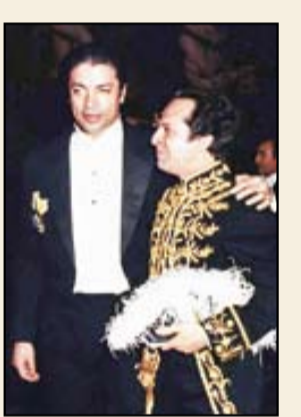
داریوش همایون در کنار منوچهر گنجی در حاشیه یکی از مراسم سلام

«تاریخ معاصر ایران یکی از پیچیده‌ترین و پرفراز و فرودترین دوره‌های تاریخی این دیار است. مقطع زمانی حساسی که در آن، کشور ما دچار تغییرات و تحولات زرفی شد. یکی از راه‌های حصول شناخت نسبتاً دقیق و جامع از تاریخ معاصر ایران به‌ویژه دوره پهلوی، بررسی زندگانی اشخاصی است که زمام امور را در دست داشته‌اند. این پژوهش جهت شناخت و بازشناسی نقش داریوش همایون، در تحولات دوره پهلوی انجام شده است. داریوش همایون فرزند نوزوله، در پنج‌م مهر سال ۱۳۰۷ در تهران به دنیا آمد. دوره دبستان و دبیرستان خود را در تهران به پایان رساند و در رشته حقوق دانشگاه تهران به ادامه تحصیل پرداخت. دوره نوجوانی داریوش همایون، مقارن با رخداد جنگ