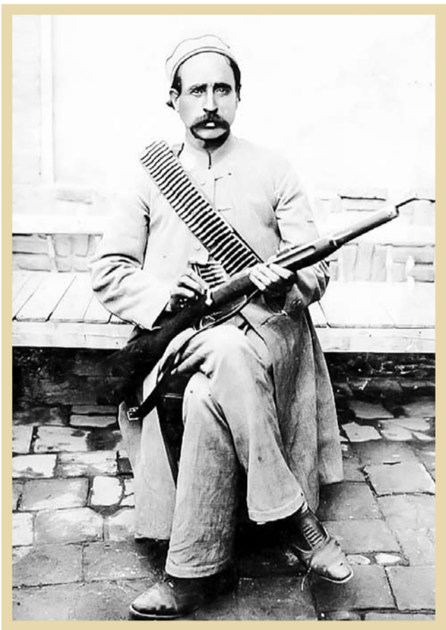
ستارخان دربار سردار ملی