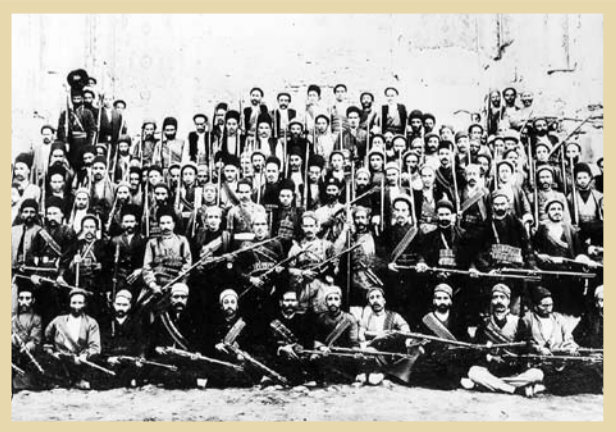
عاالی آفوج ستارخان همگام جنگ در تبریز