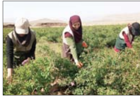
حضور جهادگران متخصص حوزه کشاورزی برای کمک به فعالان این عرصه در روستاها