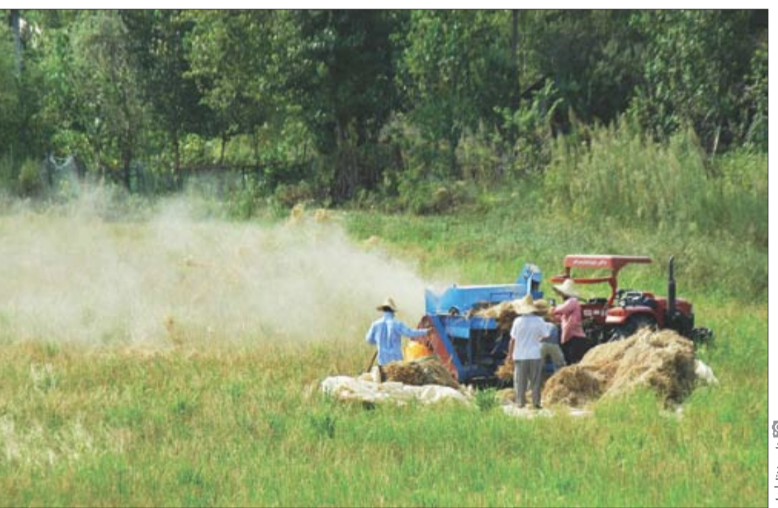
بعد از اینکه گروه های جهادی یکی پس از دیگری متولد و برای کمک به هموطنان و به علاوه ساکنان مناطق محروم و کمبرخوردار به این نقاط اعزام می شدند، قرار شد برای ساماندهی و برنامه ریزی بهتر و همچنین ارائه خدمات اصولی و جامع تر، مجمع جهادگران استانی تشکیل شود. این مجمع در هر استان تمام گروه های جهادی را زیر چتر خود گرفته و در گذر زمان به تخصصی سازی

ایجاد راه اندازی کانال و گروه در فضای مجازی یکی دیگر از اقدامات مجمع جهادگران استان آذربایجان شرقی است که به گفته رئیس این مجمع، این کار مورد استقبال گروه های جهادی قرار گرفته و بسیار مفید بوده است، چرا که گروه ها می توانند به تبادل تجربیات بپردازند و بعضاً سوره های جدیدی برای خدمت ارائه می شود. کیفی گروه های جهادی می توان به برگزاری یکی از اهداف ما در مجمع جهادگران استان تربیت جوانان انقلابی است، بنابراین با شبکه جذب استان تعامل داشتیم که در آگان ها جذب شوند. کسی که از دنیا می گذرد، می تواند از پس مسئولیت هایش برآید و بهتر خدمت کند.