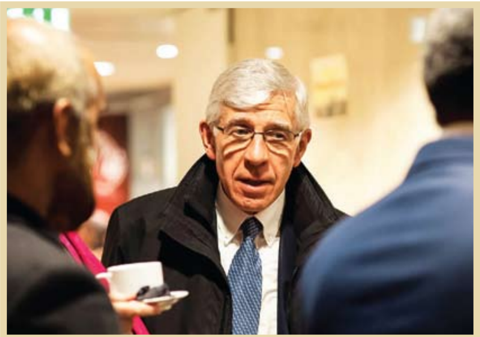
■ جنگ استرا