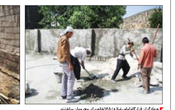
جهادگران قرارگاه امام رضاع (۱۶۵ خانه برای محرومان ساختند