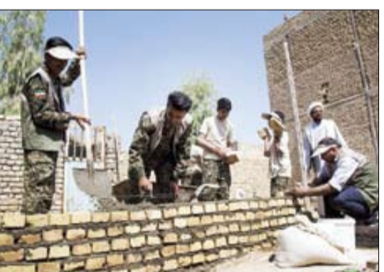
در زندان ها یا راه اندازی پوشش درختکاری و هر گونه خدمات جهادی که از سوی گروه های بسیج مشاغل انجام گرفت.

جهادگران استان آذربایجان شرقی هم از آنها مستثنا نبود. دبیر مجمع جهادگران آذربایجان شرقی در این باره می گوید: مجمع استان در قالب جهاد تواسی انتخابات و شاخصه ها برای انتخاب فرد اصلاح پرداخت، البته ما به تبلیغ در باره هیچ شخصیتی نپرداختیم و فقط صرفاً شاخصه ها مطرح شد. در واقع تلاش می کردیم اصلاح تریس روی کار بیاید و نمایندگی با روحیه جهادی باشد، چرا که افراد جهادی محرومیت ها را چشیده اند و وقتی