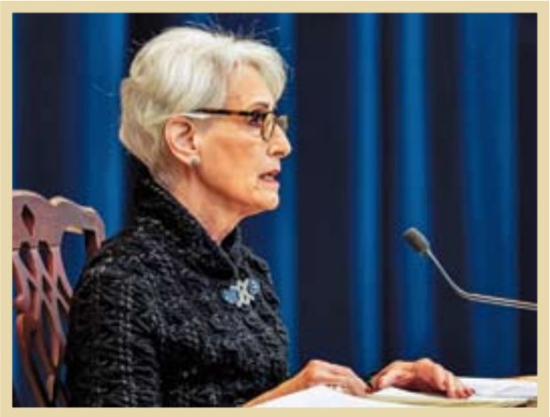
■ جنگ استرا

جالب است که استراودرباره این خیانت غریبال انکار کشورش به ایران می‌نویسد: «ایرانی‌ها همچنین نگرانی قابل درکی درباره کلک زدن‌های برتانییا داشتند. بیماری‌های همه‌گیر چون: «ژکام فرنگی»، «تیفوس» و «وبا» داشته‌اند. گرچه همین استراودر بخش اشغال ایران نیز به همین موضوع اشاره کرده، مجدداً به صدام حسین