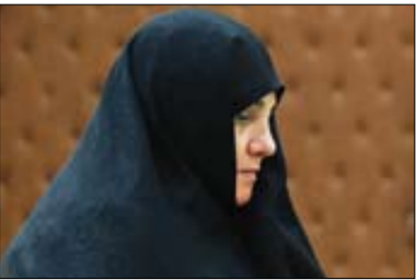
تصویر شاکیان مردم جوان

سه‌شنبه ۲۳ آبان ۱۴۰۲ | ۲۹ ربیع‌الثانی ۱۴۴۵ |