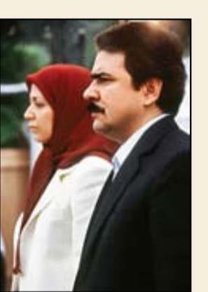
■ مسعود رجوی

«سازمان موسوم به مجاهدین خلق ایران قدیمی‌ترین، شناخته‌شده‌ترین و البته خشن‌ترین اپوزیسیون جمهوری اسلامی است که حدود سه دهه علیه این نظام فعالیت کرده است. داستان تأسیس، فعالیت، ترورها و تغییر ایدئولوژی سازمان در دوران رژیم پهلوی، سرگذشت گروهی است که با اندیشه القاطی تشکیل شد و به تدریج به دامن مارکسیسم – که آن را علم مبارزه می‌دانستند – فروافتاد. در آستانه پیروزی انقلاب اسلامی، سازمان مجاهدین بر اثر ضربات مکرری که از رژیم خورده بود، در حال اختصار به سر می‌برد، اما با پیروزی