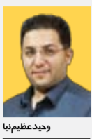
دبیر گروه اقتصاد

ذخیره‌سازی گاز به عنوان یکی از موضوعات مهم امنسال مطرح و دولت فعالانه وارد این عرصه‌شده‌ومشوق‌هایی را برای صنایع برای سرمایه‌گذاری در این زمینه فراهم کرده‌است. به باور کارشناسان در دسترس بودن تأسیسات