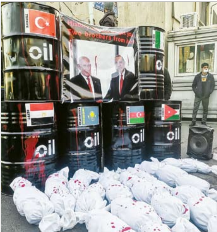
تصویری از تجمع مردمی در برابر سفارت ترکیه در ایران

حمایت‌های دوپهلوی اردوغان، رئیس‌جمهور ترکیه، واکنش‌های منفی در جهان اسلام داشته است. دانشجویان مردم در تهران در برابر سفارت ترکیه به رویه‌های اردوغان اعتراض کردند و خواهان قطع صادرات این کشور به رژیم صهیونیستی شدند. کاربران شبکه‌های اجتماعی نیز در توییت‌های خود از اردوغان انتقاد کردند. در ادامه بخش‌هایی از واکنش‌های کاربران را مرور کرده‌ایم.