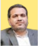
علی اصغر عنایتانی

علی اصغر عنایتانی، عضو کمیسیون اجتماعی مجلس شورای اسلامی در گفت‌وگو با «جوان» با اشاره به ضرورت تمرکز بر ذخیره‌سازی انرژی گاز در مخازن