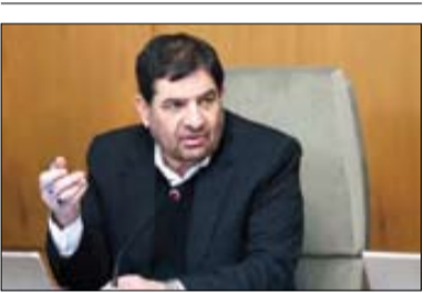
معاون اول رئیس‌جمهور مشارکت پر شور در انتخابات

فرمانده کل ارتش بسا تأکید بر اینکه هر انسانی باید موضع خود را نسبت به جنایت‌های رژیم کودک کش صهیونیستی مشخص کند، تصریح کرد: تمام انسان‌های حق طلب باید اعلام کنند در کدام سمت ایستاده‌اند، طرف حق یا همان مردم مظلوم غزه یا طرف باطل و دنیای استکبار و رژیم کودک کش صهیونیستی. اگرچه خیل عظیمی از مردم حق هستند با حمایت از غزه، دنیای استکبار را محکوم کرده و طرفدار حق طلبند، سرلشکر موسوی با اشاره به اینکه رژیم صهیونیستی نبرد را باخته و ستابان در مسیر زوال و ناپودی قدم برمی‌دارد، اذعان داشت: امروز با صدای بلند و رسا اعلام می‌کنیم، که ما در دفاع از مردم فلسطین، مقابل امریکای جنایتکار ایستاده‌ایم و ایستادگی مردم غزه، برندگی مششیر مظلوم را به همه نشان داده است.