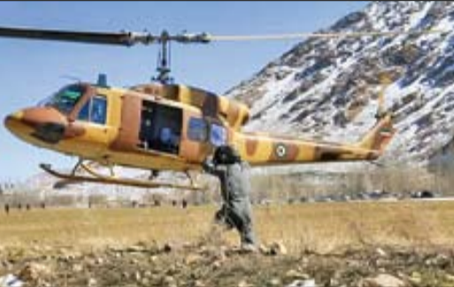
بالگردار ۳۱۴ نیروی زمینی ارتش در نقش آموزش هواپیما