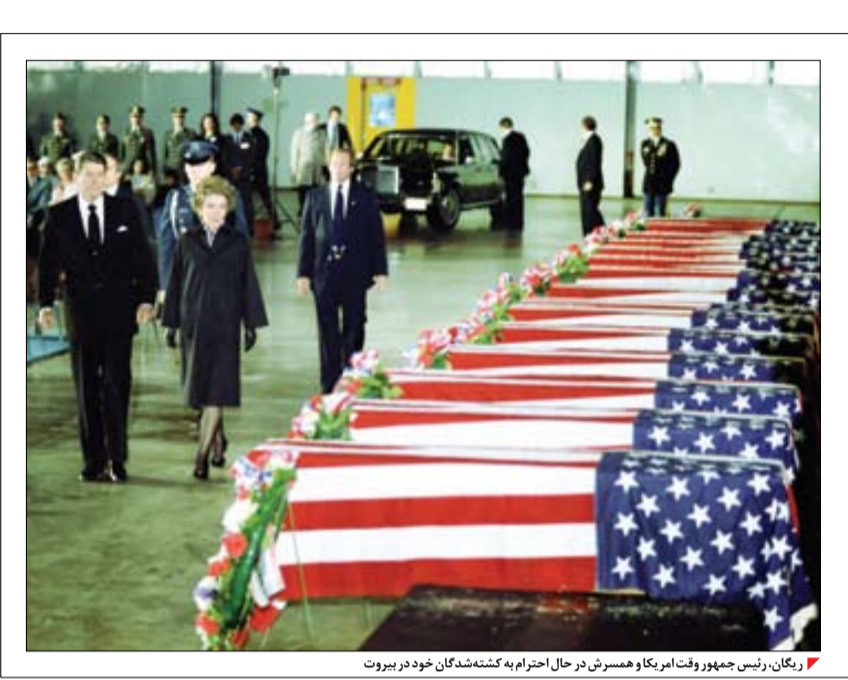
ریگان، رئیس جمهور وقت امریکا و همسرش در حال احترام به کشته‌شدگان خود در بیروت