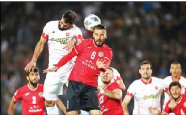
پنجم بار است می‌ایستاده شیرازگان جوان