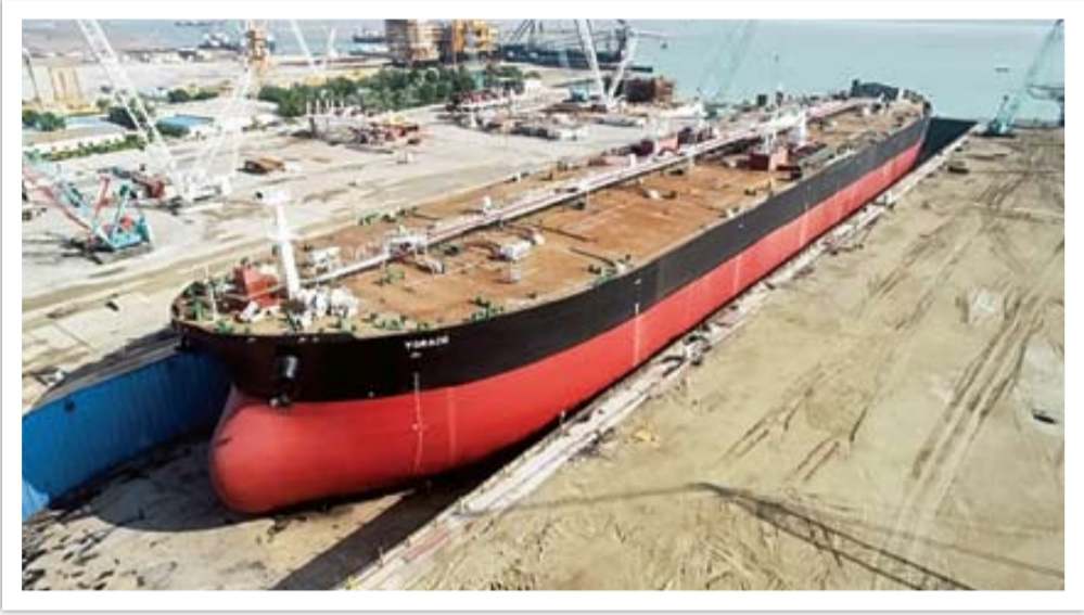
نفتکش ایرانی افرامکس که از سوی صنایع صدرا تولید می‌شود

در زمینه تأسیسات دریایی، کارخانجات مشترک دریایی ارتش و صنایع دفاع خدمات گسترده‌ای به ناوگان تجاری ایران ارائه می‌کنند و از کوچک‌ترین قطعات تا خودکشتی‌ها در این مراکز تولید و بازسازی می‌شوند. صنایع کشتی‌سازی صدرا (از طرفین همکار با قرارگاه خاتم‌الانبیای سپاه) بزرگ‌ترین کشتی‌ساز فعلی غیرنظامی کشور محسوب می‌شود و انواع مختلف کشتی را تولید می‌کند و حتی با صادرات کشتی‌های افرامکس تولید خود، ارزآوری چندصد میلیون دلاری به کشور داشته و هزاران نفر از بدنه مهندسی و فنی کشور را مشغول کار کرده‌است.