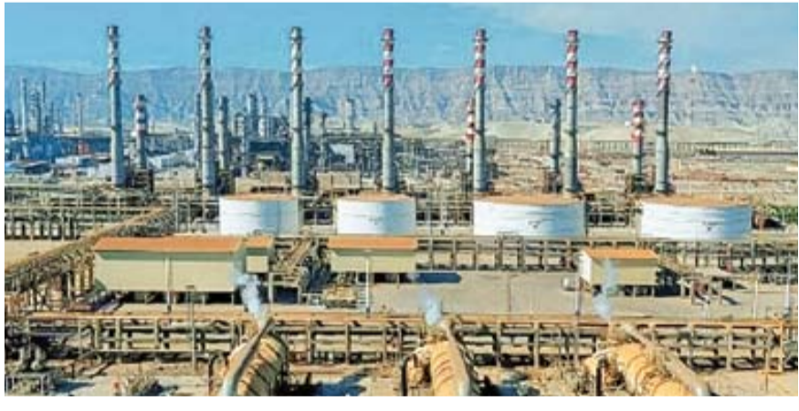
پالایشگاه عظیم و استراتژیک ستاره خلیج فارس که از سوی فراجا خام‌ساخته شد

اصولاً اولین و مهم‌ترین نهاد بر‌خوردکننده با نامنی در سطح کشور نیروی انتظامی است و نظم و پنهان حاکم بر زندگی ما با اعتماد به مجاهدت‌های مأموران انتظامی بوده است. هنگام تماشای بازی کردن کودکان‌مان در پارک، هنگام رانندگی در خیابان، هنگام ورزش صبحگاهی و حتی کوچک‌ترین کنش‌ها در سطح اجتماع، ما و خانواده ما تحت حفاظت مأموران انتظامی هستیم و مهم‌ترین عامل فعالیت و ثبات سازو کار‌های یک جامعه منظم مدنی، امنیت و نظم ایجادشده در سطح کشور است. فعالیت بازار و نهادهای اقتصادی هم بدون وجود ساختار انتظامی ناممکن است و مأموران به عنوان ضابط عام بر اجرای قوانین وضع شده در بازار نظارت می‌کنند. مقابله با اوباشی‌گری، اذیت و آزار و باج‌خواهی از کسبه، بر‌خورد با احتکارکنندگان و گران‌فروشان، مقابله با اجناس قاچاق از سوی مرزبانی و کنترل ورود و خروج مرزها و مقابله با پولشویی نمونه‌هایی از بر‌خورد انتظامی با اختلالگران امنیت هستند. رسته‌های امنیت اقتصادی، اطلاعات(سافا)، فضای تولید و تبادل اطلاعات(فتا)، فرماندهی مرزبانی و امنیت عمومی از واحدهای مؤثر بر نظام اقتصادی در ساختار اقتصاد کشور هستند.