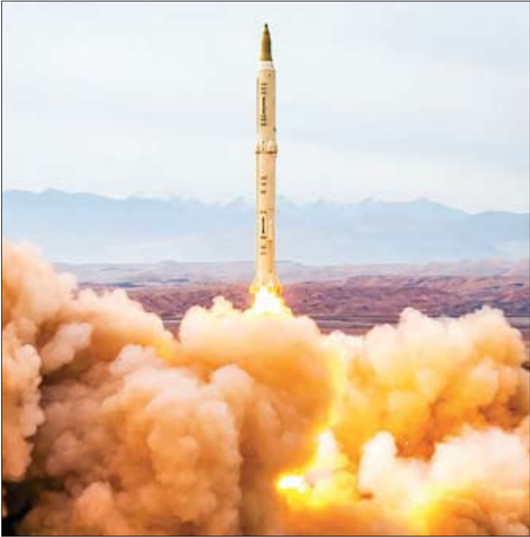
میدان شهدای لاریس

بنیان‌ریزی یک نظام مستقل و قدرتمند همواره از آرزوهای همه ملت‌های جهان بوده است. از شرقی‌ترین تمدن‌ها و اولین رگه‌های شکل‌گیری یک نظام سوسیالیستی تا غربی‌ترین سرزمین‌ها و سودای لیبرالیسم، همواره رؤیای ساخت یک نظام مدنی در راستای رفاه مردم در ذهن سیاستمداران دنبال می‌شده است.