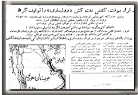
خبر توقیف نفتکش‌های ایرانی که حامل نفتشان ایران بود در روزنامه‌های ایران

شاید بهترین مثال دکتر مصدق و جریان ملی‌شدن نفت ایران باشد. بعد از ملی‌شدن نفت ایران از سوی دکتر مصدق و مرحوم کاشانی در ۲۹ اسفند ۱۳۲۹، روابط دو جانبه ایران و انگلیس به تیرگی گرایید. دولت انگلیس که با تصاحب نفت ایران و استفاده از این منبع خدادادی بر صنعت جهانی فرمان می‌راند، تاب ملی‌شدن این سرمایه‌گرانتقدر را نیاورد و انتقام استقلال‌طلبی و آزادی‌خواهی ملت ایران را از سفره مردم گرفت و با وضع تحریم‌های سنگین سعی در ایجاد اختلال در زندگی مردم و سقوط دولت منتخب مردم داشت. وقاحت و ریاچه پیر تا اندازه‌ای بالا رفت که در سال ۱۳۳۱ دولت انگلیس رسماً دستور اخلال در فرایند صدور نفت را صادر و تحریم‌های سختی را برای خریداران نفت ایران وضع کرد.