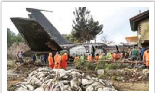
بوئینگ ۷۰۷ سقوط کرده و لاشه‌های گوسفندی که با هدف تنظیم بازار و قیمت گوشت وارد کشور شده بود

قطعات مشترک نقش مهمی در عملیاتی کردن هواپیماهای مسافربری و زمینگیر غیرنظامی داشتند. همچنین به منظور بهبود حمل‌ونقل هوایی کشور و رفع ضعف‌های به وجود آمده از جنگ و تحریم و البته درآمذسازی، ایرلاین‌ها از هواپیماهای ترابری و سوخترسان (صندلی اضافه شده بود) تأسیس شد. در دهه ۷۰ با تأسیس نیروی هوایی سپاه، هواپیماهای این نیرو هم مانند ارتش در خدمت مردم و ناوگان تجاری قرار گرفتند و تا به امروز شسرکت‌های یاس‌پر و پویا‌پر زیر مجموعه سپاه فعالیت می‌کنند. در تمام بحران‌های طبیعی و انسانی، نیروی هوایی ارتش و سپاه در خط اول امداد رسانی بودند و صدها سورتی پرواز برای رساندن کمک‌های دولتی و مردمی به شهرهای زلزله‌زده یا سلیل‌زده انجام دادند. در دوران بحران اقتصادی ۱۳۹۷-۱۳۹۶ هم ناوگان نظامی ترابری ارتش و سپاه مستقیماً وارد فضای تنظیم قیمت بازار شدند، برای مثال در یکی از مأموریت‌هایی که در راستای تثبیت قیمت گوشت در کشور به نهاجا محول شده بود، یک فروند بوئینگ باری ۱۷۲۷ ارتش یک محموله بزرگ گوشتی از قزیزستان وارد کشور کرد که متأسفانه طی اسنحادهای ۱۵نفر که عمدتاً کادر نهجا بودند، به شهادت رسیدند. همچنین نیروی هوایی، دارای چندین بیمارستان از جمله بزرگ‌ترین بیمارستان نظامی کشور (بعثت) است که به طور کامل در اختیار مردم است و روزانه هزاران نفر را مداوا می‌کنند. در کنار ارائه خدمات عمومی در تهران و شهرهای مستقر سالانه چندین طرح مردم‌پاری از سوی بهداری نهجا و هوافضای سپاه انجام می‌شود.