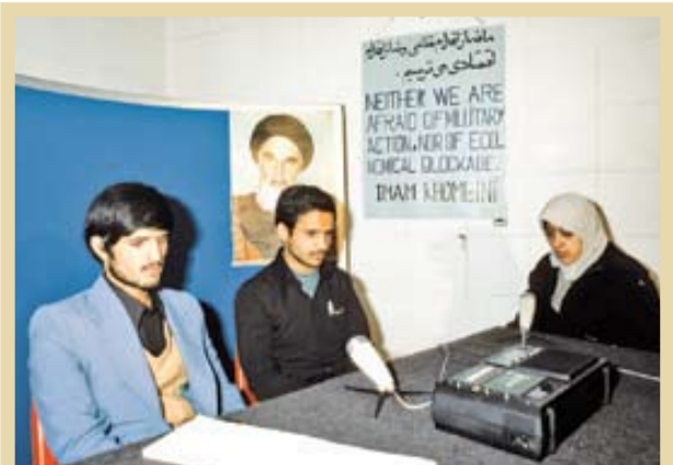
۱۳۵۸: گفت‌وگوسنجری دانشجویان بیرو خط امام در سیف‌اللهی سمت چپ