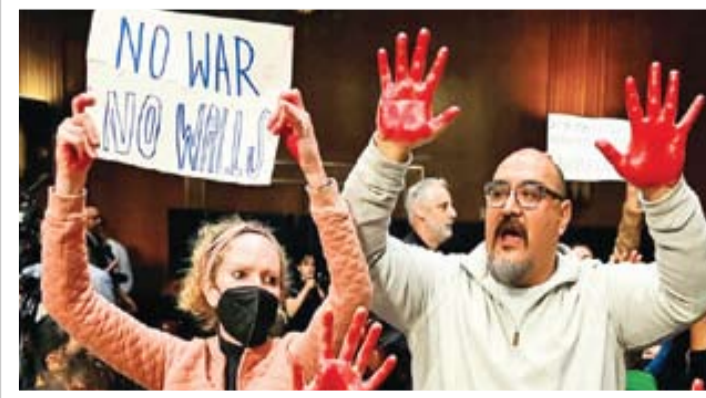
دولت‌ها نیست و اصل بر قدرت‌مندی

نوعی نهادها و سازمان‌های وابسته به سازمان ملل را به سمت خود بکشاند. معاون زنان و خانواده اندیشکده حقوق بشر و شهروندی دانشگاه امام صادق (ع) بین‌الملل بیان می‌کند: امریکایی‌ها از مهم‌ترین پشتوانه‌های مالی سازمان ملل متحد است و به همین طریق توانسته به