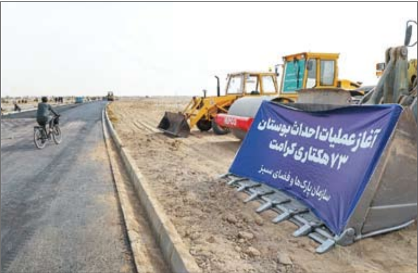
عبدالله‌زاده: کرامت بوستان