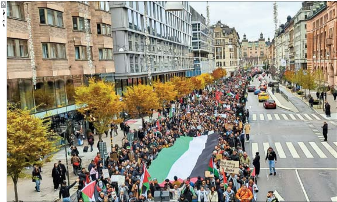
مردمان جهان علیه اسرائیل - این بار در استکهلم - به راه افتاده‌اند و اقتصاد اسرائیل از با افتاده است. بی‌شک این حجم از نفرت در سراسر جهان در آینده، اقتصاد و فروش کالا‌های اسرائیلی را با تحریم مردم جهان روبه‌رو خواهد کرد

روزنامه اقتصادی پرنفوذ فاینشال تایمز در تحلیلی نوشت: اقتصاد اسرائیل به دلیل جنگ با رکودی مواجه است که یادآور وضعیت همه‌گیری کرونا است. صدها شرکت اسرائیلی در معرض ورشکستگی قرار دارند و دولت حمایتی را که وعده داده بود ارائه نکرده است. انجمن تولیدکنندگان اسرائیلی می‌گویند دولت مردمش را رها کرده است، شرکت‌های تولیدی غرامت نگرفته‌اند و با شوک مالی مواجه شده‌اند. جنگ غزه شوک بزرگی به اقتصاد ۴۸۸ میلیارد دلاری اسرائیل وارد کرده است | صفحه ۱۵