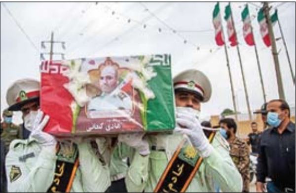
مجلس شورای اسلامی

تنه‌اساعتی بعد از سفر نخست‌وزیر عراق به تهران، حسین امیرعبداللهیان، وزیر امور خارجه گفته که امریکایی‌ها به ما پیام دادند که «به دنبال آتش بس هستیم». با این حال، به گفته وزیر خارجه ایران امریکایی‌ها در عمل از نسل‌کشی و جنایات صهیونیست‌ها در غزه حمایت کردند. چند روز بعد از انتشار نقل قول آنتونی بلینکن، وزیر خارجه امریکا خطاب به مقام‌های اسرائیلی که گفته بود «بابت حمایت از شما تحت فشار قرار داریم» حالا گزارش‌های غیررسمی بیشتری درباره اختلافات تاکتیکی بین واشنگتن و تل‌آویو در حال منتشر شدن است. روزنامه بدیعوت آحارنوت دیروز از بروز اختلاف‌نظر بین ایالات متحده و اسرائیل پرده برداشت و نوشت که کابینه نتانیاهو حاضر به تسلیم در مقابل فشارهای امریکایی‌ها نیست و همچنان در مقابل فشارهای آنتونی بلینکن وزیر خارجه ایالات متحده سرکشی می‌کند. منابع دیگری هم با اشاره به طولانی شدن سفر بلینکن به منطقه، مهم‌ترین دلیل آن را نگرانی از کنترل خارج شدن اوضاع می‌دانند، چیزی که موجب شده تلاش‌های شان را برای متقاعد کردن رژیم صهیونیستی به نوعی توافق در جنگ تشدید کنند. روزنامه فاینشال تایمز در گزارشی نوشته که بلینکن با فشارهای شدیدی از سوی متحدان نزدیک منطقه‌ای به منظور تسهیل آتش بس فوری در غزه روبه‌رو است. «ایمن صفدی» وزیر خارجه اردن به آنتونی بلینکن، هم‌تای امریکایی خود پس از دیدار یک‌روزه با دیپلمات‌های عرب گفت: ما باید برای توقف این «جنون» همکاری کنیم. «سامح شکری» وزیر خارجه مصر نیز خواستار آتش بس فوری و بی‌قیدوشرط شد. جدیدترین مورد مربوط می‌شود به سفر وزیر خارجه امریکا به ترکیه که گفته می‌شود در آنجا با استقبال سرد روبه‌رو