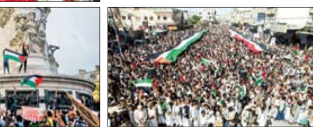
حمایت از فلسطین در پاریس