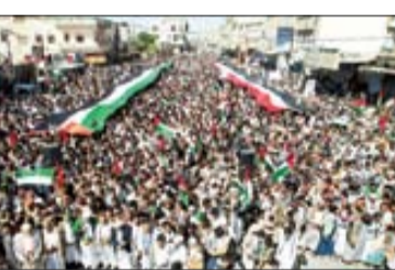
نظرات مردم یمن در حمایت از غزه

فرمانده کل سپاه: افسانه شکست ناپذیری رژیم صهیونیستی باطل شد صفحه ۲