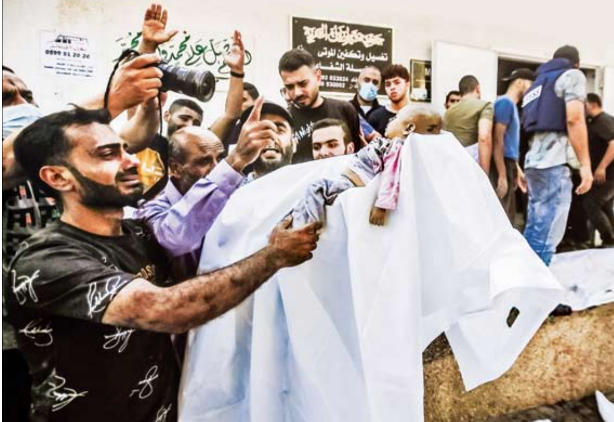
فلسطینی‌ها «یا مرگ، یا آزادی» را انتخاب کرده‌اند. سگ جمودی مثل نتانیاهو آنها را تهدید به مرگ می‌کند و حالا خیال پاکسازی نژادی دارد اما زمان نشان می‌دهد که چه کسی محو خواهد شد

رژیم صهیونیستی پس از یک هفته حملات هوایی مداوم علاوه بر شهادت و زخمی کردن هزاران نفر در غزه، اکنون پروژه پاکسازی این منطقه از فلسطینیان را روی میز قرار داده و به ساکنان آن هشدار داده که هر چه سریع‌تر از این منطقه خارج شوند؛ اقدامی که با هدف تسهیل ورود زمینی به غزه و اشغال کامل آن انجام می‌شود. همزمان وزیر خارجه ایران در دو موضع گیری جداگانه در سفر به بیروت و بغداد، احتمال گشایش جبهه جدید علیه اسرائیل را منتفی ندانست. شیخ نعیم قاسم، معاون حزب الله لبنان نیز اعلام کرد کاملاً آماده هستیم و لحظه به لحظه نبرد طوفان الاقصی را دنبال می‌کنیم و هر زمان که موعده اقدامی باشد، وارد عمل خواهیم شد | صفحه ۱۵