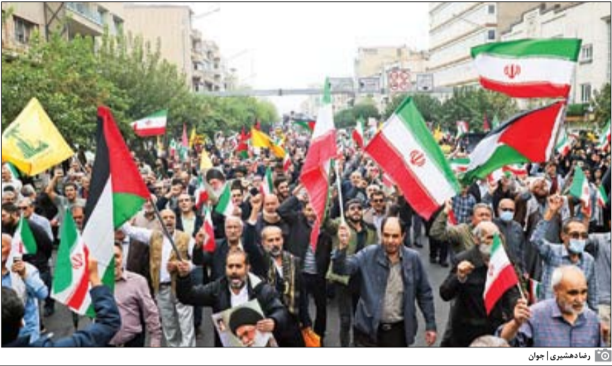
رژه‌دهشیری | جوان

سرلشکر سلامی خاطر نشان کرد: امروز با یک حیرت اجتماعی و سرخوردگی و اضطراب درونی از گسترش جنگ در سرزمین‌های اشغالی مواجه هستیم. امروز این امریکاست که مدیریت حمله به فلسطینی‌ها را در غزه انجام می‌دهد که البته کار بسیار خطرناکی است. نسخه امریکایی، هیچ دروی در مان بخشی برای حل این مسئله ندارد و همان‌طور که نسخه امریکایی در سوریه، یمن، افغانستان و عراق نتوانست راه‌گشا باشد، این نسخه برای رژیم صهیونیستی نیز محکوم به شکست است. وی ادامه داد: امروز به امریکایی‌های این مطلب را می‌گویم که شما در میان امت اسلامی تاریخی سرشار از کینه و نفرت شناخته اید؛ در عراق به خانه‌ها شلیسه حمله کردید و در زندان ابو بقریب جوانان عراقی را شکنجه کردید و صدها هزار عراقی را با خاک و خون کشیدید و سرانجام مجبور به ترک عراق شدید. مداخله شما در عراق برای عراق ارعانی جز شکست و برآی اشما جز بی‌اعتباری نداشت. حضور شما در افغانستان پس از ۲۰ سال دستاوردی جز عقب نشینی خفت بار نداشت. تنها چاره کار تغییر سیاست‌های امریکاست که باید ظهور دولت‌های مستقل فراب آسید را به رسمیت بشناسد و جز این راهی برای خروج از باتلاق‌ها برای امریکانست.