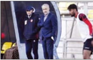
از قهر یحیی تا اوضاع بحرانی پرسپولیس