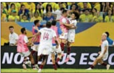
اسپانیا، اسکاتلند را پایین کشید