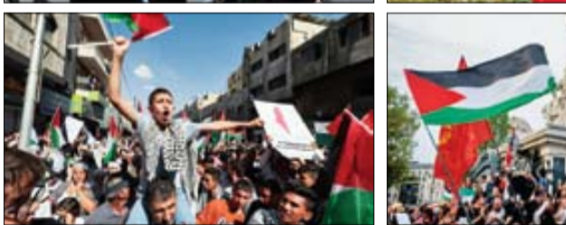
راهپیمایی اردنی‌ها در حمایت از فلسطینی‌ها