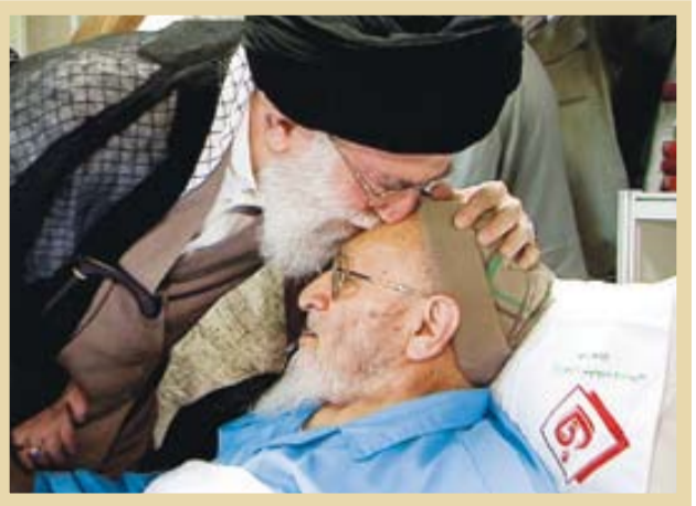
عبادت رهبر معظم انقلاب اسلامی در علامه حسن‌حسن‌زاده آملی

آیت‌الله رضا استادی از اساتید حوزه علمیه قم، در باره این خصوصیت ستودنی علامه حسن‌زاده