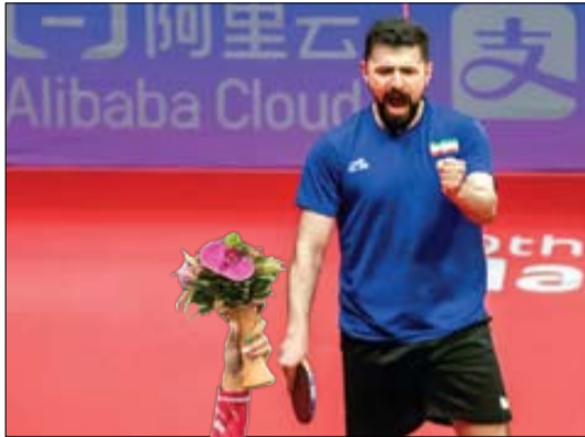
نهما عالمیان نفر چهارم رتبه‌بگماز جهان در بیست‌بگماز را شکست داد