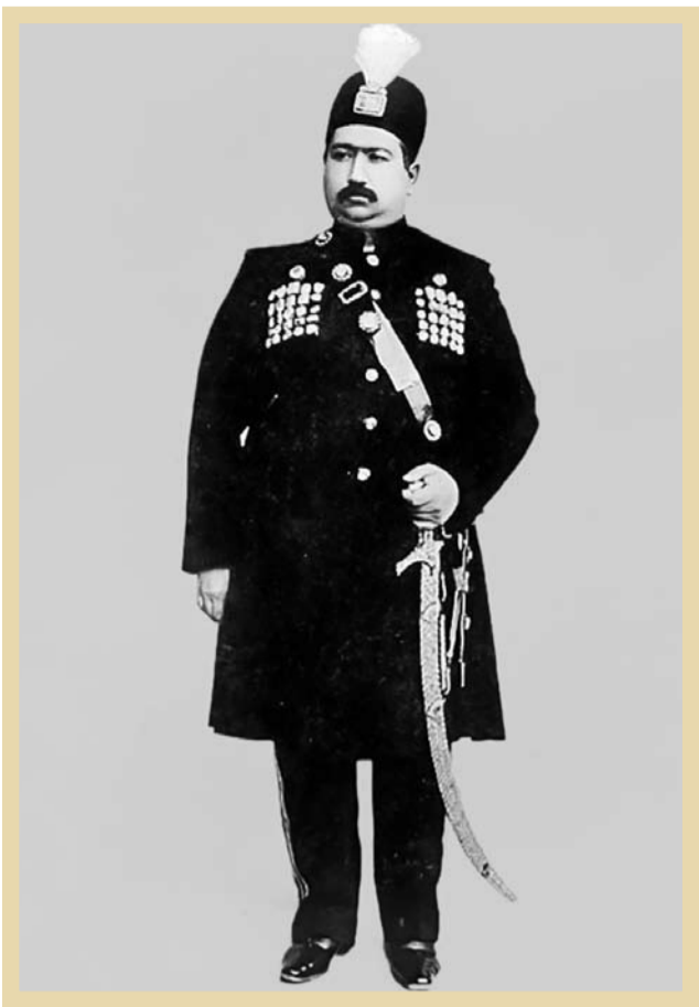
محمدعلی شاه قاجار

حکایت دشمنی با اتابک و قتل او کار مشروطه‌طلبان تدری بود که مقدمه آن را نیز طیف تقی‌زاده فراهم کرده و در مجلس شورای ملی، امین‌السلطان را «خان‌السلطان» نام نهاد بودند. حتی یاران تقی‌زاده در خوی و آذربایجان، در بی