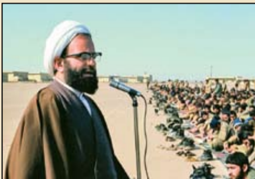
سخنرانی شهید آیت‌الله فضل‌الله محلاتی، برای جمعی از رزمندگان در دوران دفاع مقدس

تنامی ناشر در یادداشتی کوتاه در باب تجدید چاپ این یادمان‌ها چنین آورده است: «به گزارش پایگاه مرکز اسناد انقلاب اسلامی، چاپ دوم کتاب خاطرات و مبارزات شهید محلاتی با ویراست تازه و جلد متفاوت روانه بازار کتاب شد. این اثر اولین بار در سال ۱۳۷۶ از سوی مرکز اسناد انقلاب اسلامی منتشر شد که شامل گفت‌وگوهای حجت‌الاسلام‌المسلمین سیدحمید روحانی با شهید آیت‌الله حاج شیخ فضل‌الله محلاتی بود. این گفت‌وگوها در سال ۱۳۶۲ تا ۱۳۶۳ انجام گرفت و با شهادت آیت‌الله محلاتی ناتمام ماند. در سال ۷۶ این گفت‌وگوها در قالب یک متن منسجم به انضمام اسناد و نیز مصاحبه‌های خانواده شهید محلاتی چاپ و منتشر شد و امروز کتاب زندگی و مبارزات شهید محلاتی برای اولین بار تجدید چاپ شده است. این کتاب شامل یک مدخل پژوهشی درباره زندگی شهید محلاتی، متن کامل خاطرات