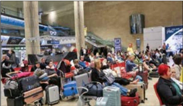
مهاجران صهیونیست در فرودگاه بن‌گورین، تل‌آویو

پناه‌بردن صهیونیست‌ها به فرودگاه‌ها اسرائیلی‌ها که از خیل عظیم کشته‌ها و زخمی‌های‌شان دچار وحشت‌شده‌اند برای در امان ماندن سعی دارند به خارج فرار کرده و در چنین شرایطی خود را از مهلکه نجات دهند. رسانه‌های صهیونیستی، دیروز تصاویری منتشر کردند که نشان می‌دهد شهرک کیشیان در فرودگاه «بن‌گوریون» برای خروج از اراضی اشغالی