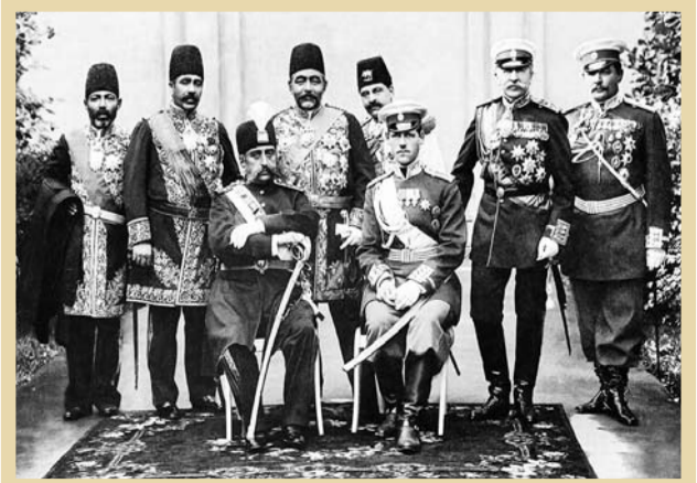
در کنار مظفرالدین شاه قاجار و اطرافیان، به سفیر به فرانک

گفته شد که محمدعلی شاه بعد از سپردن صدارت به میرزا علی‌اصغر خان امین‌السلطان امیدوار بود که با مدیریت اتابک، خرابی‌ها را اصلاح شوند و نامبرده پیگیر مذاکرات مجلس باشد و این امیدواری خود را هم رسماً اینگونه به او اعلان کرد: «جناب اشرف اتابک اعظم تلگراف‌ها را دیدم. آن‌شالله با فضل خدا و حسن تدبیر شما امیدم این است که تمام این خرابی‌ها اصلاح شود...». اما گویا برخی از اعضای مشروطه‌طلب انجمن تیریز و شاید بیش از همه طیف تقی‌زاده، به محمدعلی شاه از زمان ولیعهدی‌اش خوش‌بین نبودند و او را متمم به مخالفت با مشروطه می‌کردند. به همین جهت در آن زمان نیز شایعاتی علیه او بر سر زبان‌ها افتاد. بنابراین محمدعلی شاه در زمان ولیعهدی، عطف و مهربانی‌هایش را به همان شایعات، نامه‌ای به آیت‌الله بهبهانی نوشت و از خود رفع اتهام کرد. بعد نیز روی راپرت تیریزبان(که خواهان قانون اساسی بودند)، در شب ۲۹ ربیع‌الاول ۱۲۲۵ مطلبی نوشته و آن را برای اتابک فرستاده و به همین اتهام اشاره کرده است. نتیجتاً به نظر می‌رسد که مردم انارالله برهانه گرفتیم، بیش از آن است که ملت بتواند تصور کند و این بدبختی است از همان روز که فرمان شاهنشاه مرور انارالله بر هانه، شرف صدور یافت و امر به تأسیس مجلس شورای ملی شد، دولت ایران در عداد دول