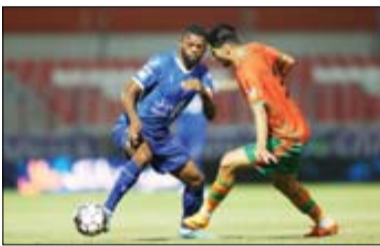
نوار پیروزی‌های سپاهان و استقلال باره نشد