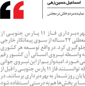
نماینده مردم خاش در مجلس

این نماینده مجلس شورای اسلامی با بیان اینکه «فاز ۱۱ پارس جنوبی» با ابتکار دولت سیزدهم پیش از موعد به بهره‌برداری رسید، ادامه می‌دهد: «دلسوزی موضوع باعث شده تا این مهم پیش از موعد به بهره‌برداری برسد، چراکه شرکت‌های خارجی تنها به دنبال کسب منافع بیشتر خود از این بخش هستند. بنابراین بهره‌برداری از فاز ۱۱ پارس جنوبی از معطلی ۲۲ساله از سوی پیمانکار خارجی جلوگیری کرد. در واقع توسعه هر کشوری به واسطه نیروی انسانی آن کشور رقم می‌خورد. بنابراین روزشمار به بهره‌برداری برسانند، در سایر بخش‌ها هم به درستی استفاده شود