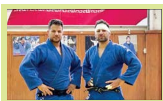
پیش‌بینی نیست، به خصوص جودو که ورزش لحظه‌هاست و در کسری از ثانیه نتایج تغییر می‌کند. در این مورد هم امیدواریم از سهمیه‌ای ایزام می‌شوند و تمریناتی که داشتیم، می‌توان امیدوار بود که اعضای تیم مبارزات خوبی به نمایش بگذارند.»