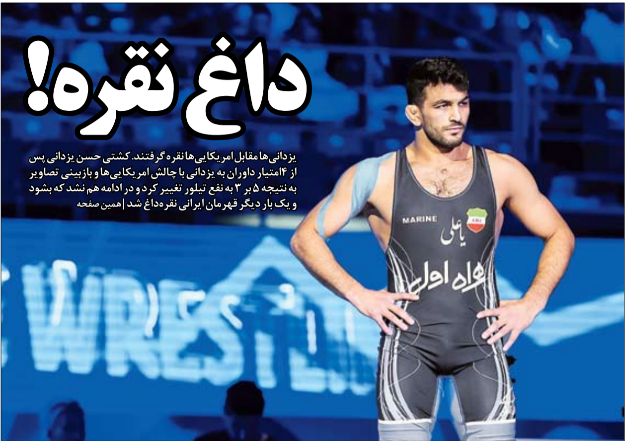
حسن یزدانی برای مردم ایران یک پهلوان است حتی اگر عنوان قهرمانی نداشته باشد

ایران اعلام عدم تعهد ۳ دولت اروپایی به یکی از مفاد برجام را که ماه آینده سررسید آن است با یک اقدام فوری و تلافی‌جویانه پاسخ داد تا مشخص شود توافق غیرمستقیم تهران و واشنگتن برای تبادل و آزادسازی ۶ میلیارد دلار از دارایی‌های ایران نمی‌تواند مانع واکنش تهران به عهدشکنی اروپا باشد | صفحه ۱۵