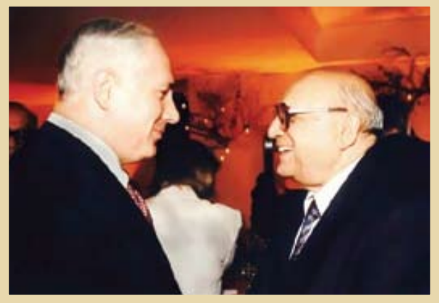
یعقوب نیمرودی در گفت‌وگو با بنیامین نتانیاهو

«نیمرودی در اول ژوئن ۱۹۶۶، در یک خانواده یهودی عراقی‌الاصل در بیت‌المقدس به دنیا آمد و خیلی زود به عضویت سازمان ترورستی هاگانا در آمد. او پاسخ‌دهنده در فعالیت‌های ترورستی علیه مسلمانان فلسطینی مشارکت فعال داشت. نیمرودی به سرعت در شبکه اطلاعاتی، جاسوسی و ترورستی اسرائیل، بله‌های ترقی را پیمود و هم‌زمان با تأسیس رسمی مוסاد، از افسران بلندپایه آن شد. وی از مهم‌ترین پایه‌گذاران مוסاد در ایران، عراق و کشورهای حاشیه جنوبی خلیج فارس بود. نیمرودی در جوانی، عضو شبکه عربی پلاخ (سنداعملیات نظامی سازمان تروریستی مخفی یهودیان صهیونیست پیش از تأسیس رسمی دولت اسرائیل) بود و در حوادث خونینی که منجر به اعلام رسمی تأسیس دولت اسرائیل شد، نقش قابل توجهی بر عهده گرفت. وی در سال‌های بعد و در جریان لشکرکشی‌های اسرائیل به کشورهای عربی، هدایت شبکه‌های اطلاعاتی – جاسوسی آن کشور را بر عهده داشت. یعقوب نیمرودی برای نخستین مرتبه، در ۵۰دی ۱۳۳۴ از طریق مرزهای ترکیه وارد ایران شد و معاونت آژانس بهود را در ایران به عهده گرفت. بدین ترتیب، او اولین افسر اطلاعاتی –جاسوسی مוסاد در ایران محسوب می‌شد. البته نیمرودی هنگام ورود به ایران ادعا کرد کنار آمدن آژانس