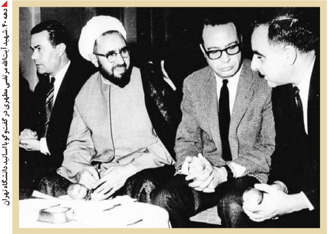
دهه ۴۰ شهید آیت‌الله مرتضی مطهری در گفت‌وگو با اساتید دانشگاه تهران