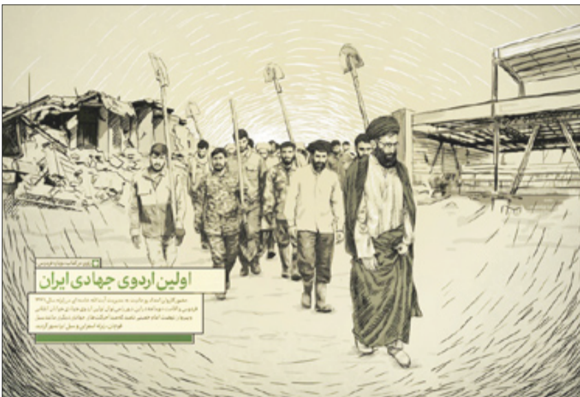
اولین اردوی جهادی ایران

بعد از زلزله ۱۳۴۷ فردوس، رهبر معظم انقلاب اولین گروه جهادی ایران را تشکیل دادند