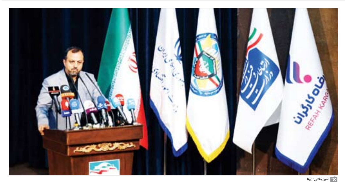
امین جلالی ابرنا

وزیر امور اقتصادی و دارایی: ۲۶ پرونده قطعی در حوزه تأمین مالی تروریسم و ۳۸ پرونده در مقابله با پولشویی تشکیل و ۶ هزار دانه درشت مالیاتی شناسایی شده است