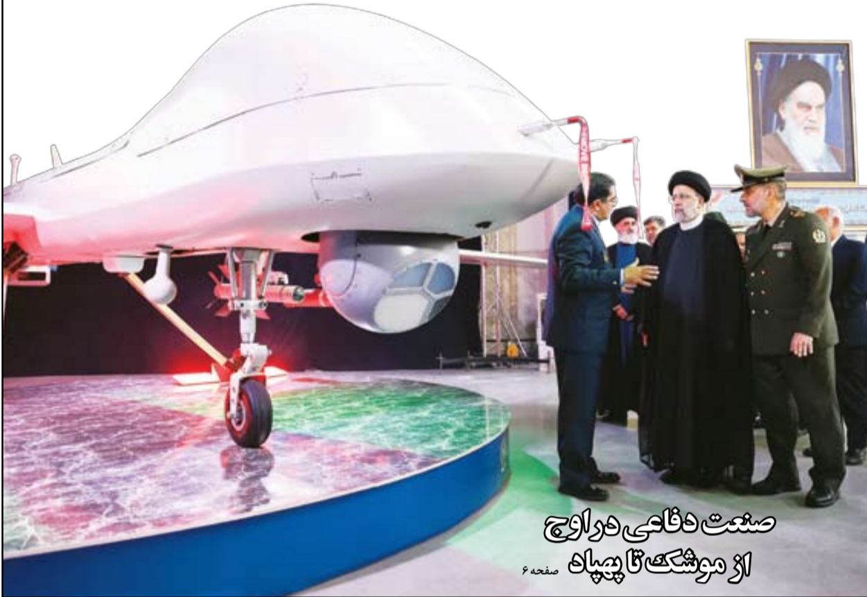
صنعت دفاعی در اوج از موشک تا پهپاد صفحه ۶

مهاجر ۱۰ یکی از کامل‌ترین پهپادهای ایران به پرواز درآمد. مداومت پروازی ۲۴ ساعته و شعاع عملیاتی ۲ هزار کیلومتری و قابلیت حمل بمب‌های قائم، الماس و دستواره و توانایی جنگ الکترونیک، به این پهپاد در ارتقای توان دفاعی نیروهای مسلح اهمیت ویژه‌ای داده است. قل‌آویو در نخستین ساعات رونمایی از مهاجر ۱۰ به آن واکنشی هراسناک نشان داد | صفحه ۲