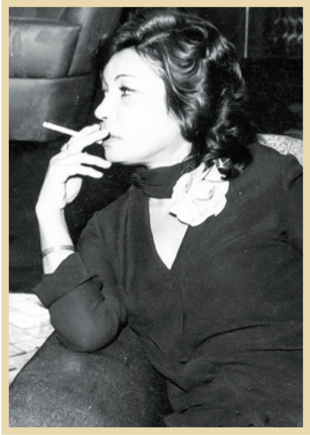
۴۰-مهرداد اشرف پهلوی

پس از پیروزی انقلاب اسلامی و کمی قبل از تسخیر لانه جاسوسی، با وجود آنکه اشرف پهلوی و خانواده‌اش در امریکا به سر می بردند، اما امریکایی‌ها همچنان به خاطر گذشته نامبرده، به وی بدبین بودند. چنانکه هنری پرشت (مسئول بخش ایران وزارت امور خارجه امریکا)، درباره ایرانیان متهم به جنایت در ایران، اشار‌های به اشرف پهلوی کرده و می‌نویسد: «بیشتر خانواده سلطنتی من جمله اشرف پهلوی، مهدی بوشهری و پسر او شهرام پهلوی، احتمالاً در ایران کشور به سر می برند. شاخه اشرف، احتمالاً در بسیاری از معاملات تجاری مشکوک دست داشته است...»