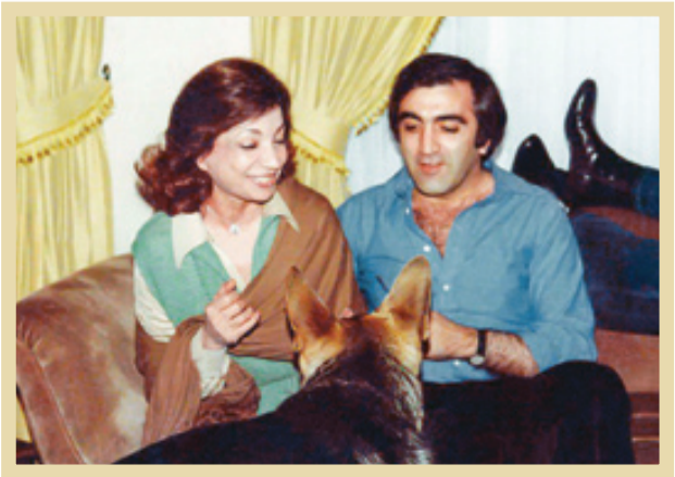
۴۰-مهرداد اشرف پهلوی در کنار یکی از دوستانش

می‌نویسد: «از اوایل رژیم شاه، اشرف دارای قدرتی در صحنه بوده و با اراده‌ای قوی و بی‌پروا، او شخصاً در اولین سال‌های نامطمئن برادرش، به استوار نمودن او کمک کرد. توطئه‌های او با ملکه مادر برای سه زن شاه و نابرداری‌اش عبدالرضا معروف است. اما از دهه ۶۰ که شاه اطمینان خود را در سلطنت به دست آورد، نفوذ سیاسی و شخصی اشرف افزون و بیشتر کارهای او در مورد امور زنان و حقوق بشر بوده است، او نماینده ایران در کمیسیون حقوق بشر سازمان ملل بوده و همچنین در صحنه سیاسی، نقش مهمی داشته است. سفر او به چین و هندوستان، باعث روابط خوب این دو کشور با ایران شد. مؤسسات خیریه و اشرف، کارهای کمی برای مردم ایران انجام داده‌اند.