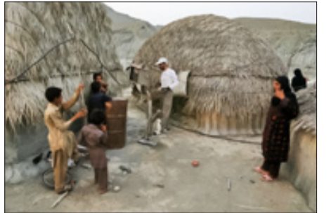
جهادگران در اقصی نقاط ایران در حال خدمات‌رسانی به نیازمندان