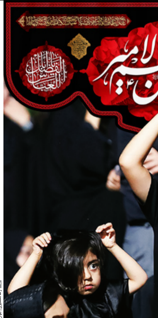
روزنامه‌شعری | جوان

شعب بعد به هیئتی دیگر می‌روم. همان بدو ورود خانمی که تقریباً حجاب نیمه‌گام دارد و کنار خیابان نشسته است و کودکی در کالسکه دارد، توجهم را جلب می‌کند. نزدیک می‌روم و خودم را خبرنگار معرفی می‌کنم و می‌پرسم چرا با بچه به روضه آمدید؟ سخت نیست؟! پاسخ ابتدایی قطره‌های اشکی است که روی گونه او روان می‌شود. به کودکش نگاه می‌کنم و می‌گویم: چرا نیایم؟ من این بچه را از لطف و کرم آقا امام حسین (ع) دارم. من نذر داشتم. یارسال در همین مراسم خواستم و چند ماه بعد برای اولین بار به کربلا رفتم و بعد از آن بار دار شدم. حالا احساس می‌کنم کمترین کار من حضور من و پسرم در مراسم برای همدردی و همراهی با مصیبت‌های امام حسین (ع) و خانواده اوست.