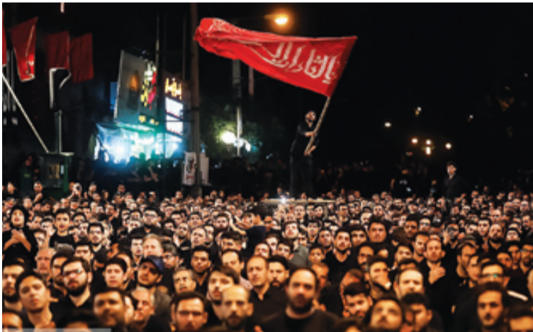
روزنامه‌شعری | جوان

اثرگذاری منوط به انتخاب درست منبر و مداح است وی در پاسخ به این پرسش که نقش خانواده و والدین در حسینی شدن و تربیت دینی فرزندان چیست؟ می‌گوید: شخصیت والی امام حسین (ع) تحولات و تدریاتی