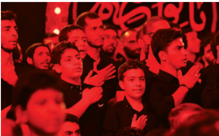
روزنامه‌شعری | جوان

ایجاد کرد، پیامبر اکرم (ص) که اشرف انبیاست در مورد سیدالشهدا (ع) می‌فرماید: «حسین منی و انا من حسینی». از زبانش بس که شیرین کام شد، جان احمد باحسین ادغام شد. پیامبر اکرم (ص) از بدو تولد تارحلت توجه خاصی به امام حسین (ع) داشت. نهضت امام حسین (ع) نهضت آزادی و در مسیر انسانیت بودن است. در واقع نهضت امام حسین (ع) برای این بود که در مقابل استبداد و زور مقاومت و دین پیامبر خدا (ص) را احیا کند. حاج داوود علیزاده در ادامه با قرائت شعری بر سخن خود صحنه می‌گذارد: بزرگ فلسفه قتل شاه دین این است / که مرگ سرخ به از زندگی ننگین است / حسین مظهر آزادی و آزادی است / خوشا کسی که چنینش مرام و آیین است / نه ظلم کن به کسی / نی به زیر ظلم برو که این مرام حسین است / منطق دین است. به فرموده امام حسین (ع) اگر دین نداری د از آزه باشی اما اثرات و انعکاس این نهضت در محافل و مجالس چه در محرم و چه غیر از محرم از کودکی تا بزرگسالی مؤثر است. معصوم (ع) می‌فرماید «العلم فی الصغر کالتقش فی الخجر» به این ترتیب اثراتی که علم و دانش و ثبت خاطرات در کودکی نقش می‌بندد تا آخر عمر اثرگذار و ماندگار است، اما این اثرات و علم و آگاهی