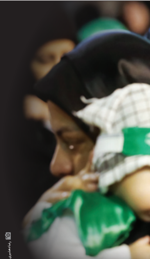
روزنامه‌شعری | جوان

نکته سوم در مورد برخی عزاداران حسینی است که بعضاً دیده می‌شود در برخورد با کودکان ملاحظت کمتری به خرج می‌دهند. بر خوردهای نسبتاً ضعیف از سوی سایر عزاداران خاطرات تلخی را از مراسم برای کودکان رقم می‌زند و در ناخودآگاه آنها ثبت و مانع از این می‌شود که شوقی برای آمدن در مراسم داشته باشند. چه بسا سعه‌صدر بیشتر همان کار مهمی باشد که بر دوش ماست تا با تحمل سمل و صدا و شیطنت‌های کودک‌ان، بتوانیم در پرورش نسلی حسینی شریک باشیم.