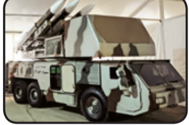
نسل اول سامانه سوم خرداد در نمایشگاه ۱۳۹۳

سوم خرداد چه ویژگی‌هایی دارد؟ همانطور که اشاره شد در ادبیات سال ۱۳۹۳ برای اولین بار سامانه سوم خرداد رونمایی شد. این سامانه می‌چیز به رادار آرایه فازی مستقر شده روی پرتابگر با هزار ۷۰۰ المان است و توانایی هدایت همزمان هشت موشک به سمت چهار هدف مجزا را دارد. این برای اولین بار بود که یک سامانه ساخت داخل به توانایی درگیری همزمان با این تعداد هدف دست می‌یافت. هر خودروی این سامانه که دارای قابلیت تحرک خارج از جاده مطلوبی هم است، دارای سه موشک بوده که می‌تواند می‌چیز به رادار مستقل روی خودرو هم باشد. موشک این سامانه از نوع سوخت جامد با بالک کنترلی در انتهای بدنه بوده که به صورت مایل پرتاب می‌شود. بخش استقرار موشک‌ها در خودرو قابلیت چرخش در دو راستا را برای قرارگیری در مناسب‌ترین زاویه نسبت به هدف پیش از شلیک دارد. در نمایشگاه مورد اشاره موشک‌های طائر ۲ و