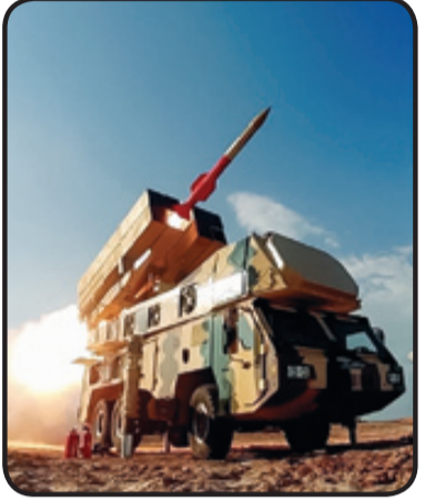
شلیک موشک ۹۹ از سامانه سوم خرداد