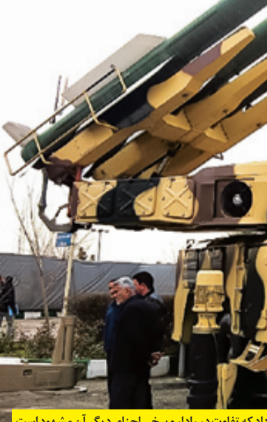
نسل جدید سوم خرداد که تفاوت در رادار و برخی اجزای دیگر آن مشهود است

در جدیدترین تحول سامانه سوم خرداد هم این سلاح از رشدند طبق وعده داده شده به فرماندهی کل قوا با استفاده از یک موشک جدید که در قسمت پیشران (موتور) سوخت جامد قطر بیشتری نسبت به موشک‌های قبلی طائر دارد، برد درگیری موشکی این سامانه به ۲۰۰ کیلومتر ارتقا پیدا کرده است. با توجه به ماهیت متحرک این سامانه افزایش برد آن به ۲۰۰ کیلومتر سبب بهبود چشمگیر شعاع خطر برای پرنده‌های دشمن شده که قصد استفاده از مهمات دورایستنا علیه اهداف زمینی را دارند. سوم خرداد برد بلند همچون گونه قبلی سامانه از سه موشک روی هر پرتابگر استفاده می‌کند. امروزه با گسترش این سامانه در نواحی مختلف کشور و تنوع موشکی ایجاد شده برای آن، سامانه سوم خرداد که به عنوان یک سلاح بومی در ابعاد مختلف و جزئیات کلیدی برای دشمنان کاملاً بلاشک است، در کنار شبکه یکپارچه پهپاد هوایی کشور در دفاع از آسمان ولایت شب و روز نمی‌شناسد و متخصصان شجاع پدیدآورنده آن هم قطعاً در حال تقای آن برای عملکرد هرچه بهتر در آینده هستند.