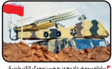
سامانه سوم خرداد می‌چیز به جست‌وجوگر الکترواپتیک که روی سقف و جلوتر از موشک‌ها مشهود است