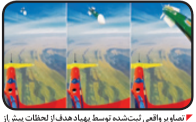
تصاویر واقعی ثبت‌شده توسط پهپاد هدف از لحظات پیش از اصابت موشک ۶ متری طائر به هدف ۳ متری ابابیل ۲