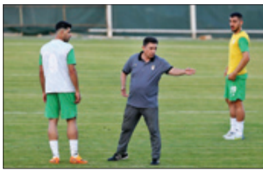
تلاش قلعه‌نویی برای تغییر نگرش در تیم ملی