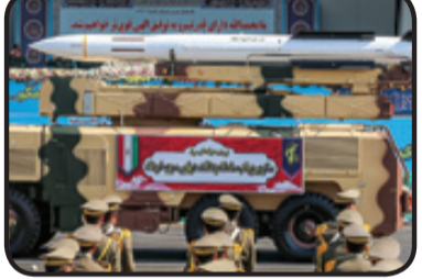
موشک سوم خرداد برد بلند با برد ۲۰۰ کیلومتر

بعدی ارتش تروریستی امریکا دانست. این پهپاد علاوه بر نقش جاسوسی به شیوه‌های مختلف ذکر شده، در واقع یکی از گره‌های ارتباطی قدرت هوایی دشمن هم است که علاوه بر نقش‌های شناسایی و اطلاعاتی کار رله ارتباطات را نیز بین واحدهای مختلف زمینی، هوایی و دریایی به انجام می‌رساند. پرنده شکارشده می‌چیز به پیشرفته‌ترین سامانه‌های هشدار فعالیت راداری، هشدار قفل موشک و سامانه یکپارچه جنگ الکترونیک بوده که اسامی و شرح کلی کارکرد آنها در منابع مختلف اینترنتی قابل دسترس است، اما سؤال وارد این است که چرا این پهپاد موفق به شکستن قفل راداری نشده؟ آیامی توان فرض کرد این پهپاد متوجه شلیک موشک شده اما برای نشان دادن حسن نیتی چندصد میلیون دلاری، اقدام به جنگ الکترونیک نکرده؟ بدیهی است که سطح بالایی از فناوری در جست‌وجوگر موشک سامانه سوم خرداد به کار گرفته شده که در مقابل جنگ الکترونیک پرنده امریکایی تسلیم نشده یا اساساً سپاه به شیوه‌های خاموش، این پرنده را ردگیری و در فاز نهایی قفل راداری را انجام داده است؛ شیوه‌ای که ایرانیان در آن صاحب سبک و متبحر هستند.