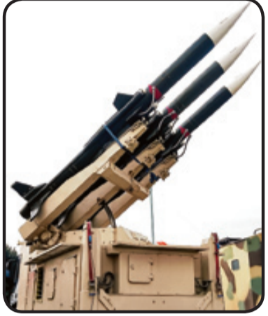
سامانه رعد ۱

پهپاد جاسوسی گلوبال هاوک امریکایی در ساعت ۱۴ دقیقه بامداد از پایگاه هوایی الفکره کشور امارات در جنوب خلیج فارس به هوایم می‌خیزد و برخلاف قوانین هوانوردی تمامی تجهیزات مربوط به معرفی خود را خاموش می‌کند و در نهایت پنهان کاری از تنگه هرمز به سمت چابهار ادامه مسیر می‌دهد. مأموریت این پرنده شناسایی و جاسوسی با استفاده از انواع حسگرهای نصب‌شده روی آن بوده است. اما از آنجا که در بحث نظامی، اشراف اطلاعاتی حرف اول را می‌زند و این اشراف باید به گونه‌ای باشد که تمام پرنده‌ها و شناورهای نظامی در منطقه تحت اشراف داشته باشند، این پرنده جاسوسی نیز از پرواز خود از مبدأ تحت نظر پهپاد هوایی ایران بود. این پرنده در مسیر بازگشت از حوالی چابهار به سمت امارات متحده عربی، چند مرتبه حریم هوایی ایران را نقض می‌کند که در این زمان در ارتفاع بالای ۵۵ هزار (بیش از ۱۵ هزار متر) بوده است. یک هواپیمای گشت دریایی P-8 در ارتفاع ۳۰ هزار پایی (حدود ۹ هزار متری) در فاصله کمتری هم پهپاد شناسایی - رزمی MQ-9 پرواز جاسوس امریکایی را همراهی می‌کردند. این سه پرنده همگی زیر نظر پهپاد هوایی بودند تا داده‌های رویداد شده آنها مورد پایش قرار بگیرد.