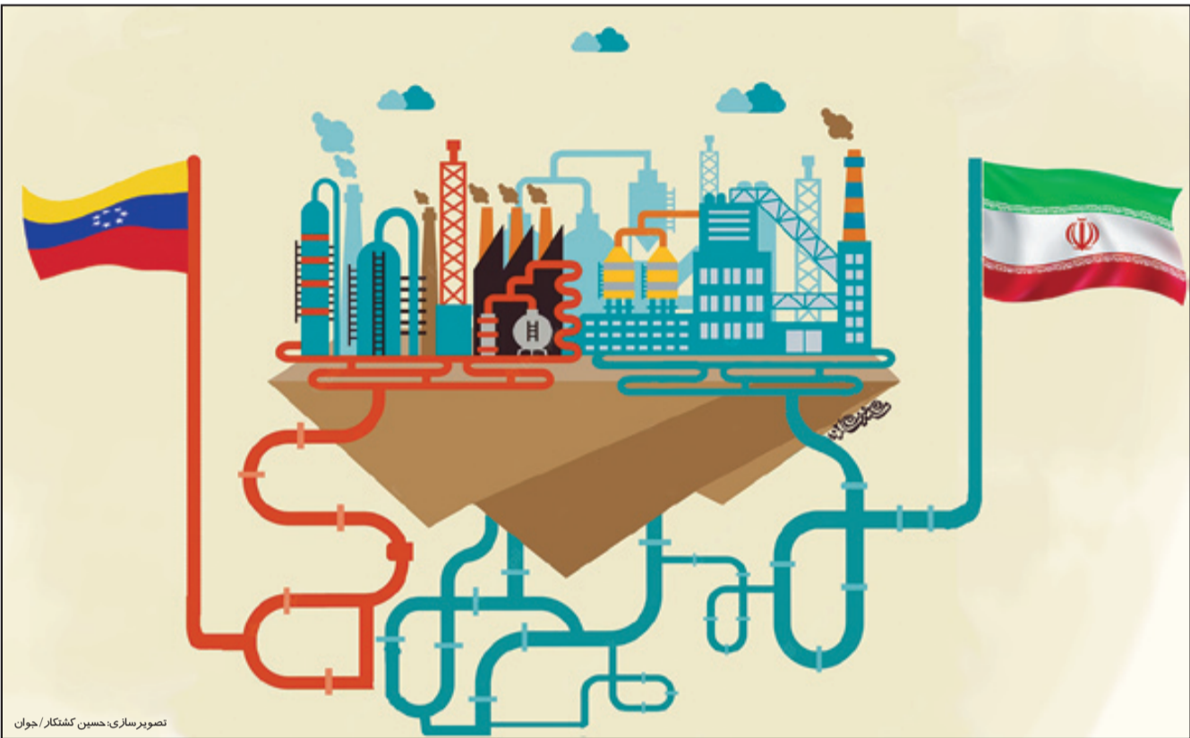
تصویرسازی: حسین کشککار/جوان

باز معماری تجارت نفت خام ایران با بازسازی پالایشگاه‌های نیمه‌فعال کشورهای همسو ممکن است