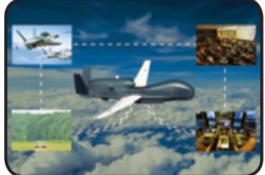
هواپیمای جاسوسی فوق پیشرفته گلوبال هاوک