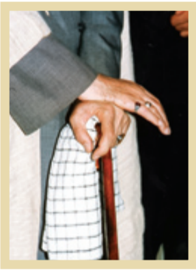
ششمین روز از تیرماه ۱۳۶۰، نماز ظهرگاه خونین