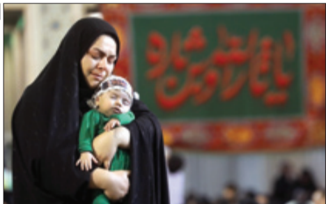
رهبراجدیری اخیرنگار گروه اجتماعی

رئیس دستگاه قضا در تازه‌ترین سخنان خود تأکید کرد که «مجازات باید متناسب، عاقلانه و اثربخش باشد». برخی این تذکر محسنی‌زاده‌ای را در کنار تذکر مهدی فضلایی، عضو دفتر حفظ آثار مقام معظم رهبری که به اهمیت «عقلانیت» بودن احکام قضایی اشاره کرده بود، می‌گذارند و نتیجه می‌گیرند، روی اشاره این تذکرات به احکامی است که در روزهای اخیر برای برخی هنجار شکنان جامعه صادر شده است | صفحه ۶