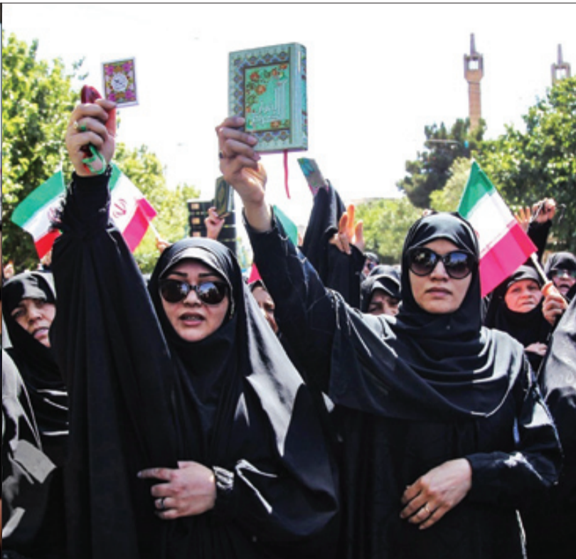
شهرهای ایران و عراق و برخی کشورهای اسلامی دیروز در دستان راهپیمایان مسلمان خود، هم کتاب قرآن داشت، هم تصاویر رهبر معظم انقلاب و حاج‌قاسم سلیمانی. این بهترین پیام به قرآن سوزی در غرب بود