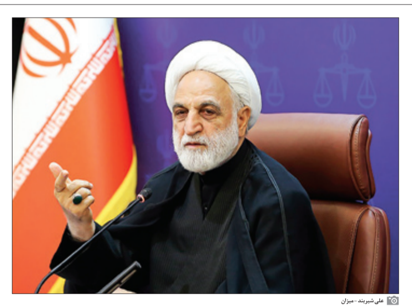
علی‌شیریند - میوزن

رئیس دستگاه قضا در تازه‌ترین سخنان خود تأکید کرد که «مجازات باید متناسب، عاقلانه و اثربخش باشد، زیرا اگر مجازات تعیین‌شده موجب وهن دستگاه قضایی باشد، از اثر گذاری آن محروم می‌ماند.» برخی این تذکر محسنی‌اژه‌ای را در کنار تذکر مهدی‌فضالی، عضو دفتر حفظ آثار مقام معظم رهبری که به اهمیت «عقلانه» بودن احکام قضایی اشاره کرده بود، می‌نگارند و نتیجه می‌گیرند، روی‌آورد این تذکرات به احکامی است که در روزهای اخیر برای برخی هنجار شکنان جامعه صادر شده است. حتی اگر چنین نیانید، حکم قضایی باید محکم و پدیدرنده باشد و نه اینکه در جامعه بحث و چون‌وچرا ایجاد کند. از همین رو اشاره به «عقلانه» بودن حکم در سخنان رئیس دستگاه قضا و هم در نوشته عضو دفتر حفظ آثار گواهی است بر اینکه معیار همه‌پذیری به نام عقل داریم که نباید از آن تغلّی شود.