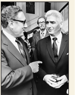
ویلیام سولیوان در گفت‌وگو با هنری کیسینجر

سولیوان در بخشی از خاطرات خویش، در باب خیالات متفاوت شاه و هویدا دربارہ چگونگی مهار انقلاب اسلامی، چنین می‌نویسد: «شاه که در مصر بود، محاسباتی داشت و احتمالاً به وسیله از شیر زاهدی، از امکان یک حرکت نظامی برای سرکوبی انقلاب اطلاع یافته بود. او در نظر داشت یک روز در آسوان توقف کند و بعد طبق برنامه قبلی به پالم اسپرینگز در آنتیبرگ آمریکا رفته و