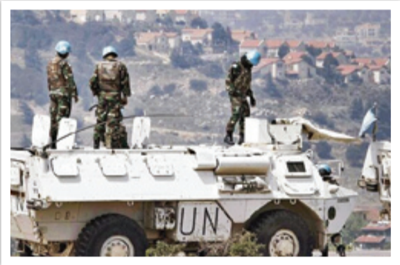
نیروهای یونیفل پس از برقراری آتش بس در مرز ایران و عراق مستقر شدند

ایرانی با اجساد نیروهای دشمن بودید؟ بله، خوب یادم است روز تبادل ساعت حدود ۱۰ صبح بود که بچه‌های ما با کمک نیروهای قرارگاه جسد حدود ۱۰ عراقی را در تابوت گذاشتند و به جلو و محل تبادل انتقال دادند. بعد چند نفر