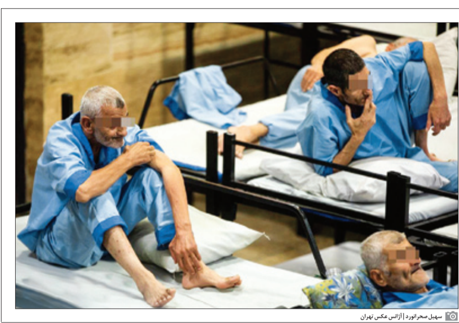
سهیل صحرائورد ازانیس عکس تهران

یاور اینورشهر جز احترام چیزی از کارکنان و مددکاران