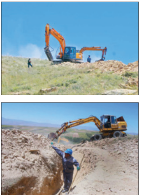
جهادگران بسیج سازندگی در مسیر محرومیت‌زدایی و آبادانی روستاها، آبرسانی به ۱۲۱ روستای محروم آذربایجان شرقی را انجام می‌دهند.