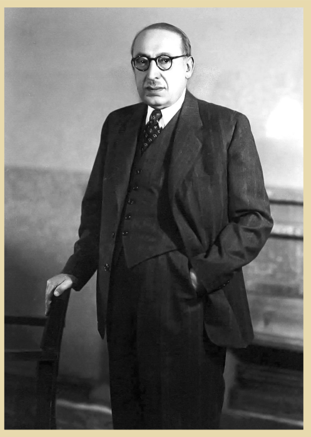
۱۳۰هجدهد ۱۳۰هجد قوام معروف به قوام السلطنه