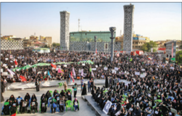
جمعیت سالی جوان

بدون مجوزها آن قدر خیالشان راحت است که تولیدات خلاف قانون را منتشر و آکران هم می‌کنند و آب از آب تکان نمی‌خورد! چرا وقتی برای ساخت یک مستند یا فیلم کوتاه چند دقیقه‌ای باید چندین بار سالن‌های وزارت ارشاد بر برخی دستگاه‌های دیگر زحمت کرد، چطور می‌شود که عده‌ای می‌توانند در یک پروژه بزرگ به تنهایی فیلم و سریال بدون مجوز تولید کنند، بلکه همان تولیدات غیرقانونی را می‌توانند در شبکه نمایش خانگی و جشنواره‌های خارجی عرضه کنند