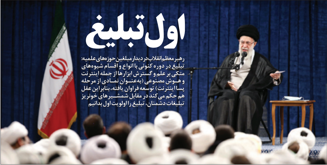
در آستانه ماه محرم قرار گرفته‌ام و رهبر معظم انقلاب مبلغان مذهبی را بر حذر داشتند که چیزی جز تبلیغ دین و ایمان اولویت آنان باشد | صفحه ۲ | Leaderir

رهبر معظم انقلاب در دیدار مبلغین حوزه‌های علمیه: تبلیغ در دوره کنونی با انواع و اقسام شیوه‌های متکی بر علم و گسترش ابزارها از جمله اینترنت و هوش مصنوعی (به‌عنوان نمادی از مرحله پسا اینترنت) توسعه فراوان یافته، بنابراین عقل هم حکم می‌کند در مقابل شمشیرهای خونریز تبلیغات دشمنان، تبلیغ را اولویت اول بدانیم