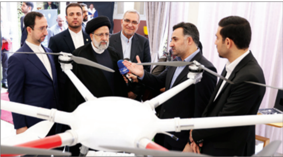
ایران دیگر اکنون هر جا می‌رود با پهپادهایش می‌رود! ایران آینده سوار فناوری‌های نوین خود به جهان پرواز خواهد کرد

رئیس‌جمهور اسلامی ایران باامداد چهارشنبه که در صدر هیئتی عالی رتبه، به دعوت رسمی رؤسای جمهور سه کشور کنیا، اوگاندا و زیمبابوه، به آفریقا سفر کرده است، این نخستین سفر یک رئیس‌جمهور ایران به کل قاره آفریقا پس از ۱۱ سال است که در راستای سیاست خارجی جامع، متوازن و مبتنی بر همکاری در عین چندجانبه‌گرایی اقتصادی دولت سیزدهم، با هدف افزایش حضور ایران در اقتصاد حدود ۶۰۰ میلیارد دلاری قاره آفریقا صورت می‌گیرد