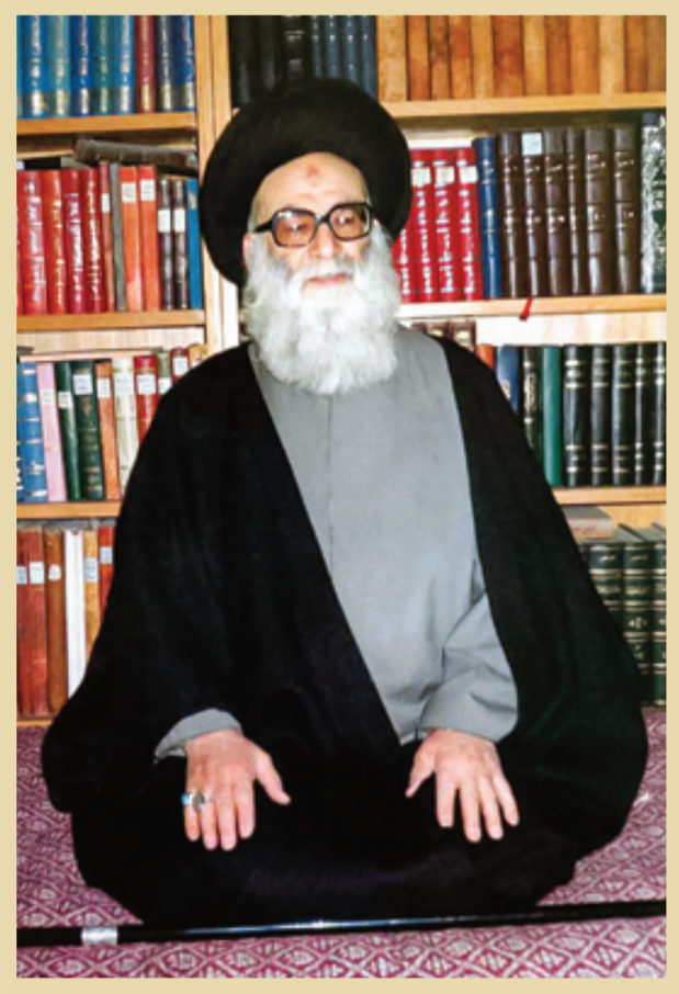
آیت‌الله علامه سیدمحمدحسین حسین‌بهشتی طهرانی

زنده‌یاد آیت‌الله سیدمحمدحسن حسین‌بهشتی طهرانی، فرزند زنده‌یاد آیت‌الله علامه سیدمحمدحسین حسین‌بهشتی طهرانی، در دیپاچه یادمان پدر، در باب نگاه رهبر معظم انقلاب اسلامی به مرتب آن عارف مجاهد چنین آورده است: «روزی پس از از تحال مرحوم والد (قدس سره) به اتفاق سایر اخوان، در محضر آیت‌الله خامنه‌ای (مدظله) بودیم. ایشان ضمن صحبت، مطلبی را از مرحوم والد بیان کردند و فرمودند برای من به قطع اثبات شده است که پدر شما، از عنایت الهی بر اشرف به نفوس بر خوردار