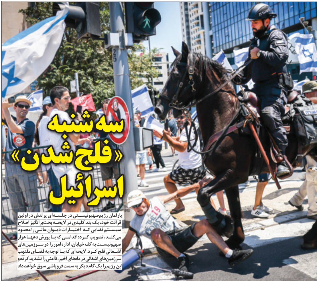
بعد از ماه‌ها اعتراضات خیابانی در تل‌آویو علیه نتانیاها، این بار معترضان بزرگ‌راه‌ها را مسدود کردند که با واکنش خشن پلیس همراه شد | صفحه ۱۵

قیمت‌های قبلی برای خودروهای مونتاژی تعیین کرد! این یعنی شکستن کمر خریدار. دستگاه قضایی باید در این باره ورود کند. سال کنترل تورم است، نه سال تحمیل تورم. چه چیزی فرق کرده است که ناگهان روی یک خودروی خارجی مونتاژی حقوق سه سال یک کارگر را اضافه می‌کنند؟! | صفحه ۴