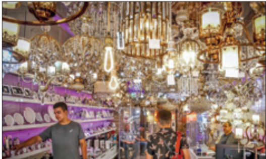
عید غدیر، عید ملی ایران

نزدیک به یک هفته از جشن عید غدیر گذشته و جامعه در حال آماده‌شدن برای ورود به ماه محرم است، ولی هنوز حواشی این جشن ادامه دارد؛ اتفاقی که البته با توجه به بزرگی این رویداد دور از ذهن هم نیست. در شرایطی که برخی رسانه‌ها و جریان‌های سنی داشتند با کم‌اهمیت نشان دادن این جشن به سرعت از آن عبور کنند، حضور میلیونی مردم خود را در قالب بین‌المللی تعریف کرده‌اند و می‌توان به ادامه آن امید داشت. نخستین