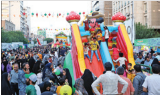
«جوان» از بازتاب‌های اجتماعی جشن غدیر گزارش می‌دهد