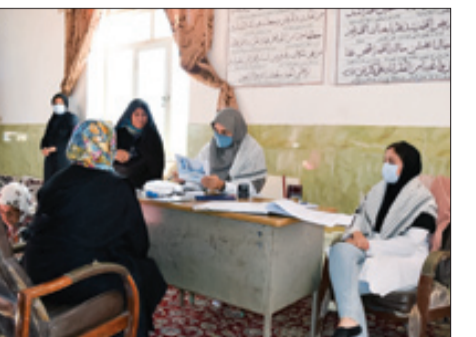
خدمات بهداشتی و درمانی جهادگران در مناطق محروم