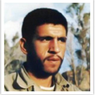
شهید نادعلی طلعتی

خاطراتی از ۳ شهید دفاع مقدس در گفت‌وگو با رزمنده لشکر ۱۰ سیدالشهدا(ع)