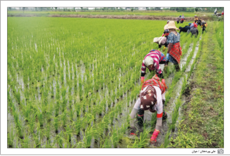
علی پوردهقان / جوان

دلالتان نمی‌گذارند سفره مردم برنج ارزان وارداتی به خود ببینند!