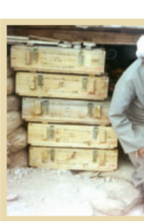
شهید آیت‌الله محمد صدوقی در بازدید از جبهه‌های جنگ

محبوبیت و نفوذ آیت الله صدوقی، وجه مشترک خاطرات جمله آنان است، که در باره او سخن گفته و خاطرات خویش را به تاریخ سپرده‌اند. با این همه جای این پرسش است، که این جایگاه اجتماعی چگونه به وجود آمد؟ و محبوبیتی اینچنین از چه