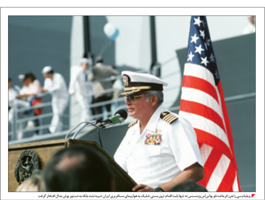
▶ ویلیام سی راجرز فرمانده نوا یواس‌ا و سناتور سنه تنها یاب‌فرد تمام‌تورسوت شلیک به هواییهای مسافربری ایران تنبیه نشد بلکه به دستور بوش مدال افتخار گرفت

هوایپمای مسافربری پرواز شماره ۶۵۵ هوایپمایی جمهوری اسلامی ایران ۲۵سال پیش (۱۲ تیر ۱۳۶۷) از بندرعباس به مقصد دویب در حرکت بود. این هوایپما به دستور ناخدا ویلیام سی راجرز سوم با شلیک موشک هدایت‌شونده از ناو جنگی یواس‌اس ونینسنس متعلق به نیروی دریایی ایالات‌متحده امریکا، بر فراز خلیج‌فارس سرنگون شد و تمامی ۲۹۰ مسافران آن جمله ۶۶ کودک جان باختند، هر چند کمیته تحقیقات اعلام کرد این دستور بر اساس فرآیند شناسایی مسافرایی‌بودن هوایپمای ایرانی صادر شده‌است، اما ناخدا راجرز از دستار پرزیدنت جورج بوش برای رفتار بسیار شایسته در زمان فرماندهی‌ناو ونینسنس، مدال لوژویون در یافت کرد. امریکا هرگز مسئولیتی بر رخدادر ابر عهده نگرفت و در مورد پرداخت پول به ایران از اصطلاح Ex- Gratia Payment استفاده کرد، یعنی پرداخت فرامت از سر لطف در حالی که هیچ مسئولیتی بر عهده امریکا نیست. چرا امریکا این گونه بر خورد کرد؟ برای فکر کردن درباره این سؤال سراغ کتابی ۱۰۰صفحه‌ای از پروفیسور روزه گاردوی می‌رویم.