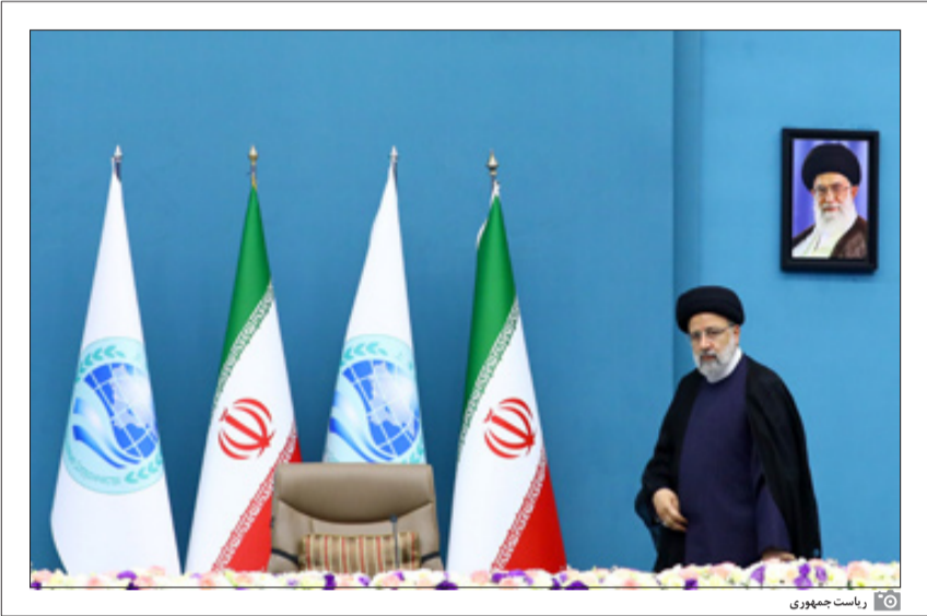
سران شانگهای در نشست مجازی

تأمین امنیت دسته‌جمعی، رهنمون شدن به‌سوی توسعه پایدار، گسترش پیوندها و ارتباطات، تقویت وحدت، احترام‌بیش‌از پیش به‌حق حاکمیت کشورها و هم‌افزایی برای مقابله با تهدیدات محیط زیستی را فرام‌آورد. رئیس‌جمهور کشورمان سپس درباره نقش آفرینی جمهوری اسلامی ایران در این شش حوزه، نکاتی را بیان کرد.