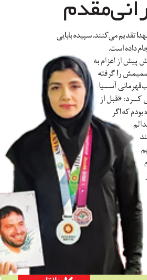
بازتاب شمیم رضوان

مربی قاره دانستند. پس از درخشش تیم ملی آلیش بانوان کشورمان که با کسب مقام قهرمانی در هر دو بخش همراه شد، مسئولان آلیش آسیا طی مراسمی با هدای مدال و حکم هدیه تقدیمی، سرمربی ایران را به عنوان بهترین مربی آسیا در سال ۲۰۲۳ انتخاب کردند. نکته حائز اهمیت اینکه این بانوی ایرانی پس از انتخاب به عنوان بهترین مربی قاره، مدال طلای خود را به خانواده شهید کشتی‌گیر شاهرخ زرغام اهدا کرد.