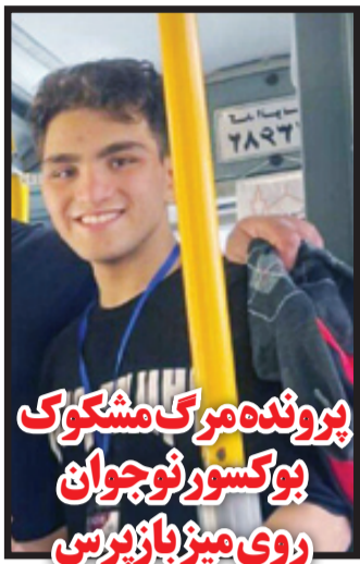
پرونده مرگ مشکوک بوکسور نوجوان روی میز بازپرس

بوکسور نوجوان عضو تیم ملی که یک‌سال قبل در تمرینات اردوی آماده‌سازی برای مسابقات جهانی به طرز مرموزی به کام مرگ رفته بود، پرونده‌اش برای بررسی در اختیار باز پرس ویژه قتل دادسرای امور جنایی تهران قرار گرفت. در این پرونده یکی از بوکسورها به عنوان مظنون برای تحقیق به دادسرا احضار شد.