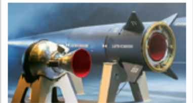
نمای دیگری از موتور سوخت جامد گرو با خروچی یا نازل متحرک برای کنترل بردار رانش در مرحله دوم فتاح