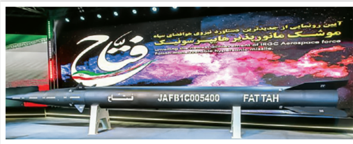
فتاح، جدیدترین دستاورد موشکی کشور در یک نسل فنی جهش یافته