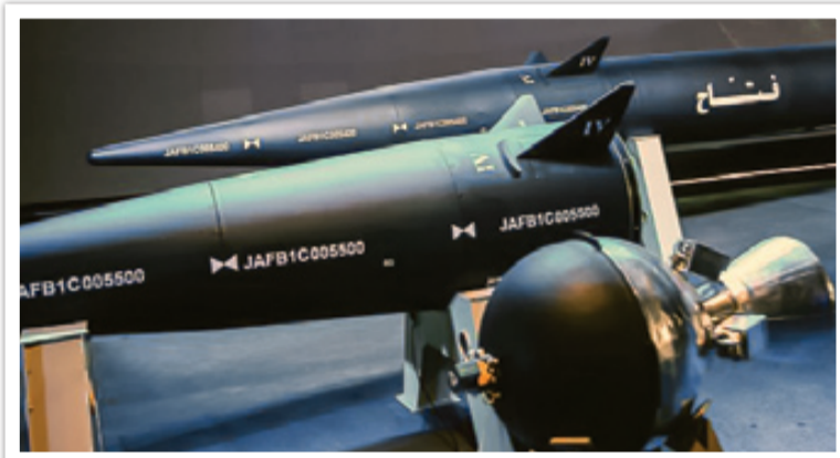
سر جنگی یا همان مر حله دوم موشک فتاح با موتور سوخت جامد گرو