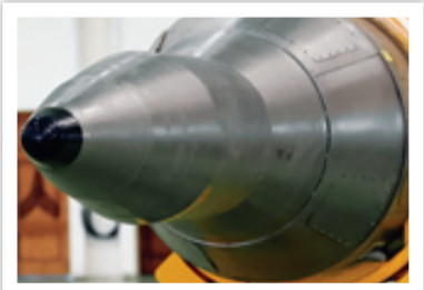
سر جنگی موشک سجیل و ماده فناشونده به عنوان سپر حرارتی به رنگ مشکی در نوک آن

پرتابه باز هم در صدانگهی احتمال درگیری موفق با سلاح مهاجم پرسرعت وجود دارد، هر چند این امر بر پایه شلیک تعداد زیادی موشک پدافندی به سمت یک هدف مهاجم و البته در جو رقیق شاید ممکن باشد، زیرا سرعت موشک‌های پدافندی هم متناسب با غلظت هوا کاهش می‌یابد، اما در صورت ایجاد قابلیت تغییر مسیر، آن هم به صورتی که از هیچ رویه و الگوریتم تکراری تبعیت نکند، امکان ردگیری شدن پرتابه به کمترین حد ممکن می‌رسد.