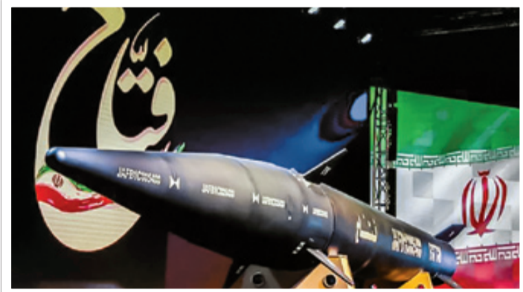
ماده مقاوم به حرارت در دماغه موشک فتاح

موشک هایپر سونیک فتاح برخلاف طرح‌های آمریکایی، روسی و چینی شکل ظاهری مشابه موشک‌های قبلی بالستیک ایرانی دارد اما آنچه سبب ایجاد قابلیت‌های طرح شده برای تسلیحات هایپر سونیک در فتاح، در داخل بدنه آن قرار گرفته است. این شکل ظاهری به خودی خود نشان‌دهنده این است که ایران در مسیر توسعه سلاح هایپر سونیک، دنباله‌رو هیچ یک از سه کشور فوق نبوده است. این عدم‌شابهت با نمونه‌های خارجی، مسئله‌ای است که حتی کارشناسان هوافضای صهیونیست هم به آن اذعان کرده‌اند. همچنین به عملیاتی و نه صرفاً یک طرح توسعه‌ای بودن این موشک هم توسط کارشناسان خارجی