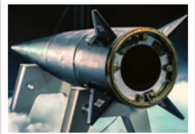
نمای نزدیک از مرحله دوم موشک فتاح که محل قرارگیری موتور سوخت جامد و نیز بالک‌های کنترلی روی بدنه مشخص است

موشک مدافع می‌شود. این مورد دشمن می‌دهد تسلیحات هایپر سونیک قابلیت عملیاتی در جهت بی‌اثر کردن سامانه‌های دفاع موشکی دشمن را دارند. مطلبی که صراحت بیان آن توسط فرمانده نیروی هوافضای سپاه نشان می‌دهد هدف اصلی از توسعه چنین سلاحی در ایران، ناکارآمد کردن و از دور خارج کردن سامانه‌های دفاع موشکی دشمن شامل پاتریوت و تاد او بوده است.