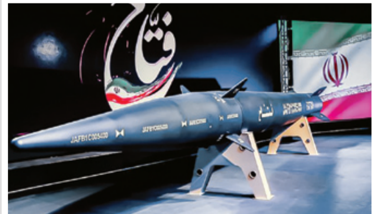
موشک بالستیک فتاح، ضد سامانه‌های دفاع موشکی دشمن