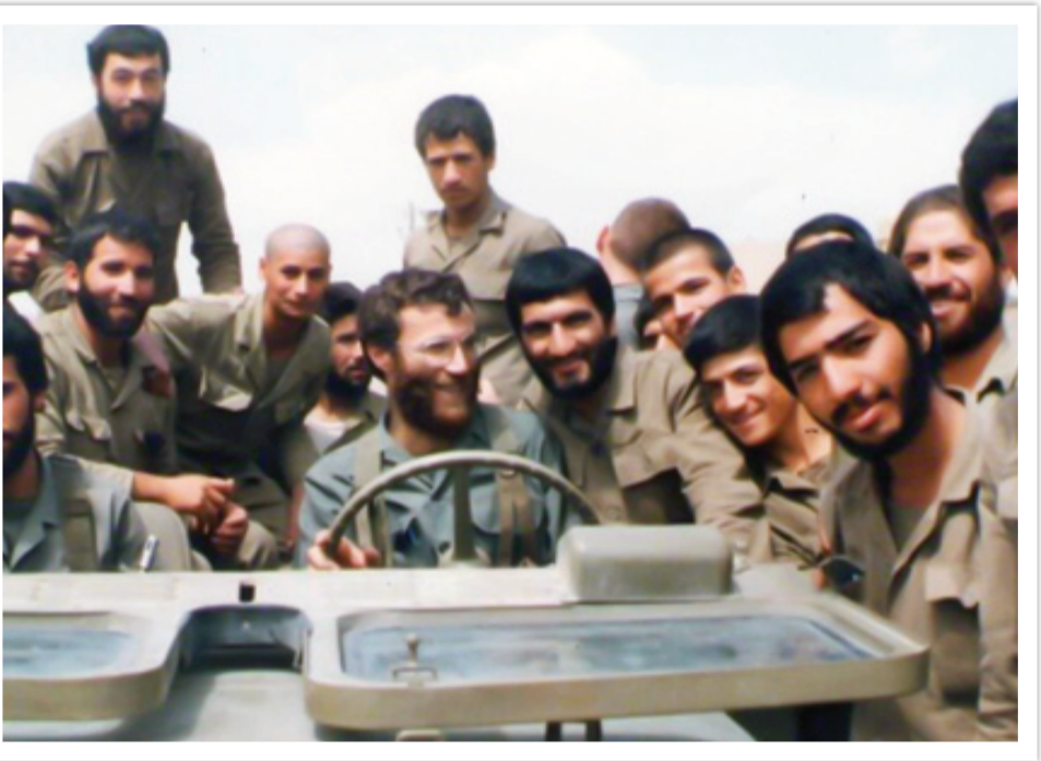
شهید پروچری به‌صورت سبک‌ساز در هم‌زمانی با شش

از همان اوایل تشکیل سپاه به آن ورود کردم، اما عضویت رسمی نبود، یعنی از نظامی‌گری خوشم نمی‌آمد. تا سال ۱۳۶۰ که فرمانده پایگاه سپاه در رواسر بودم، هنوز رسماً سپاهی نشده بودم. یک بار که آمدم تهران برای انجام یکسری از کارها، سردار سعید صادقی، مسئول نیروی انسانی گفت: شما حکم فرماندهی سپاه رواسر را از برادر برجرودی دارید و هنوز پاسدار نشده‌اید؟ بپایید