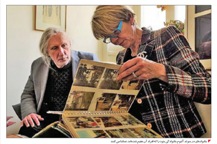
خانوادهای در سوئد آیوم خانوادگی خود که افراد آن عقیم شده‌اند، تماشا می‌کنند

یورونیوز: امریکا و اروپا میلیون‌ها نفر از افراد را به بهانه بهسازی و اصلاح نژادی عقیم کردند