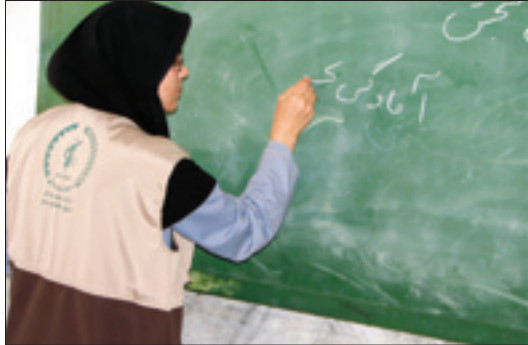
حمایت‌های بسیج‌سازی‌های موجب اشتغال‌زایی در استان‌ها شده است.