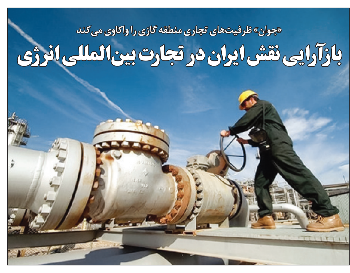
کارکنان شرکت ملی گاز ایران در حال بازدید از یکی از واحدهای تولید گاز در استان خراسان جنوبی.