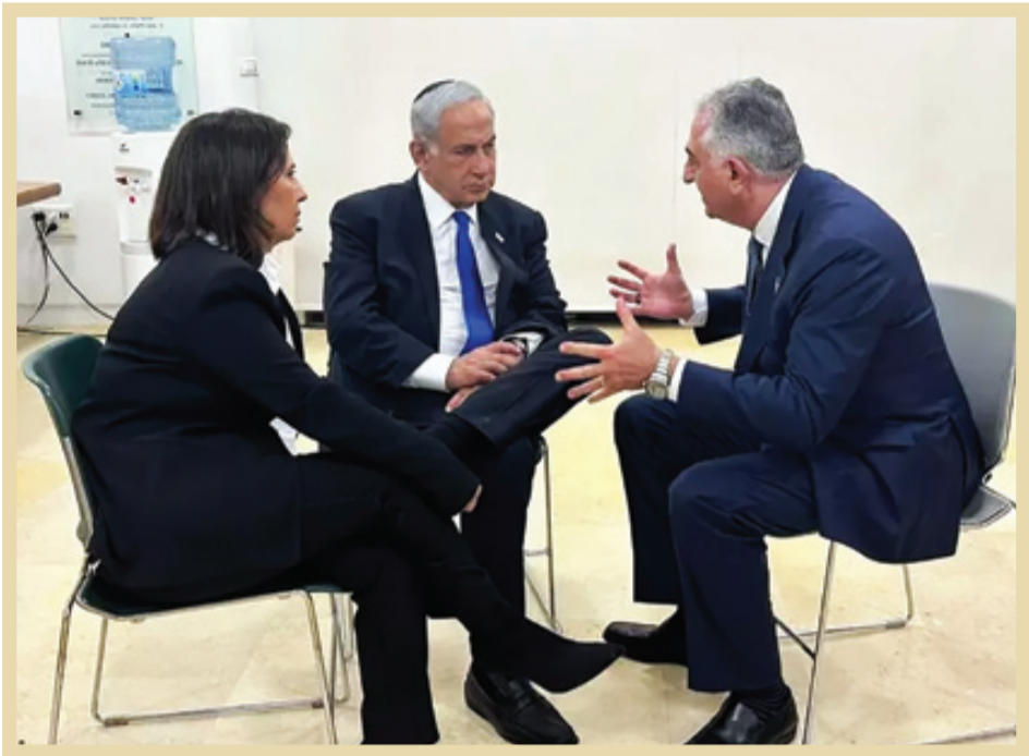
برخی نمایان‌دهن رضا پهلوی و نمایان‌هاو در این عکس را با وجود تکامل عبرت آموز می‌دانند.

از سفر رضا پهلوی به اسرائیل تصویری منتشر شد که اوج حقارت وی را نمایان ساخت. تصویری از جلسه مهم و راهبردی‌اش با نتانیاهو در پشت درهای بسته، با حضور دو عدد سطل آشغال ناظر، در مکانی شبیه به آبدار خانه! این تصویر با واکنش‌های طنز آلود مواجهه شد، چنانچه آمد: «فرزند شاه گفته بود که قصد داشته با متخصصان اسرائیلی، درباره مواجهه با بحران آب ایران مذاکره کند، برای همین است که لوکیشن برگزاری جلسه گفت‌وگو، در جایی شبیه به آبدار خانه انتخاب شده است...»