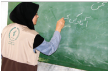
حمایت‌های بسیج سازندگی موجب اشتغال‌زایی در استان‌ها شده است.