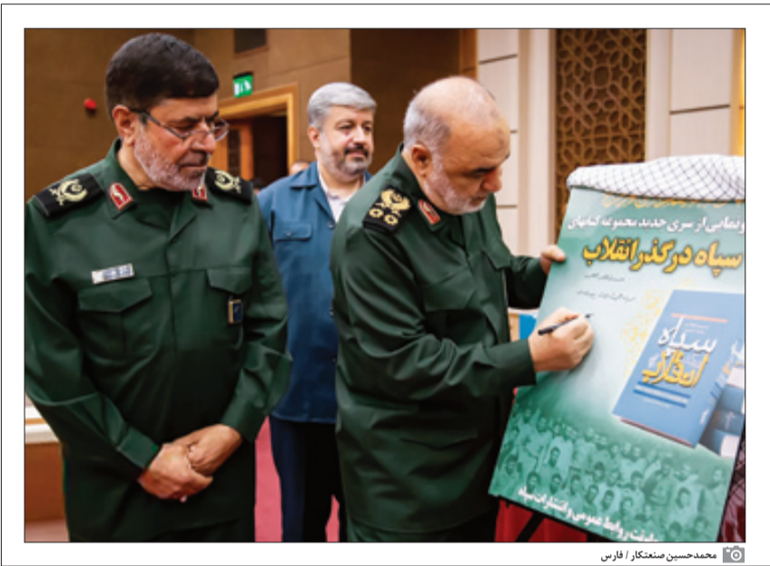
محمدحسین مستنکر / فارس

فرمانده سپاه پاسداران را با تأکید بر اینکه سپاه همچنان ناشناخته است و شیر قدرت سپاه هم در همین ناشناختگی است،گفت:اگر امروز دنیا در جنگ اقتصادی است، سپاه برای ا یک جنگ ساختار سازی می‌کند و اگر در میدان جنگ نیابتی وارد شود، سپاه از دور قدرت می‌سازد. سپاه پلدا است چگونه زیر دید و تیر دشمن قدرت بسازد و همواره یک قدرت جاری است. به گزارش سپاه‌نویز، سردار سرلشکر پاسدار حسین سسلامی، فرمانده کل سپاه در مراسم رونمایی ۲۲جلد از کتب «سپاه در گذر انقلاب» گفت: آیات زیادی در قرآن وجود دارد که حقیقت