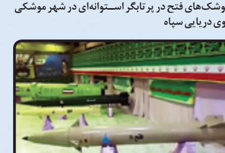
مقایسه ابعاد موشک فاتح با فاتح و راکت زلزلال

در هفته‌های اخیر رسانه‌های غربی بر محور خبری احتمال فروش موشک‌های بالستیک ایرانی به روسیه اصرار دارند، همانطور که در سال گذشته بر خط تبلیغی فروش پهپاد به روسیه توسط ایران تأکید می‌کردند. اینکه هدف از این رویکرد چیست و غرب در مواجهه با ایران چرا به دنبال گسترش چنین ادعایی است و اینکه آیا روسیه به موشک‌های ایرانی نیاز دارد یا اینکه موشک‌های ایرانی برای روسیه مفید خواهند بود، مواردی است که جداگانه قابل بحث و بررسی است، اما اصل ماجرای ثابت شدن کارایی پهپادها و موشک‌های ایرانی برای ناظران خارج می‌شود. سبب علاقه‌مندی کشورهای متعددی به خرید پهپاد از ایران شده یک واقعیت روشن و البته قابل افتخار برای کشورمان است. در گزارش‌های متعدد قبلی صفحه دفاعی روزنامه جوان به انواع پهپادهای ایرانی پرداخته شده بود اما در این گزارش مرور سریعی بر انواع مختلف موشک‌های بالستیک برد کوتاه تا متوسط ایرانی خواهیم داشت تا مخاطبان گرامی نگاه گذرایی بر تمام عناصر آرایه موشکی سطح به سطح بالستیک کشور داشته باشند. ■■■■