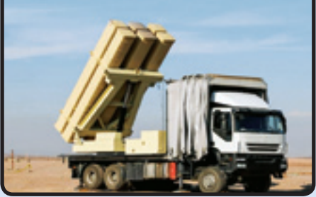
پرتابگر شش تایی مکعب‌مستطیلی موشک فاتح