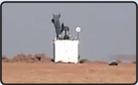
اصابت بسیار دقیق موشک هرمز - ۱ به رادار