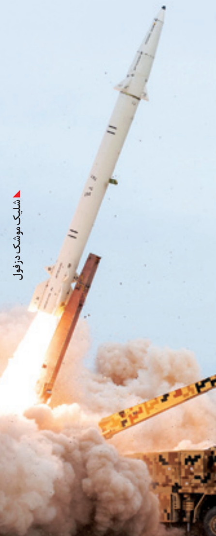
شلیک موشک ذوقول

حالی که راکت‌های فجر ۵ و نمونه‌های هدایت‌شونده آن از پرتابگر چهار تایی شلیک می‌شوند. لازم به ذکر است موشک فاتح که با نام صادراتی BM-120 هم معرفی شده است، علاوه بر سرچنگی انفجاری شدید از سرچنگی تر کشی منفجر شونده در ارتفاع مشخصی بالای هدف و سرچنگی نفوذگر در استحکامات و بتن هم می‌تواند استفاده کند. عملکرد این نوع از سرچنگی‌ها برای موشک فاتح در ویدئوهای منتشر شده توسط وزارت دفاع و پشتیبانی نیروهای مسلح که سازنده موشک‌های فاتح و فتح است، به نمایش گذاشته شده است، اما اطلاعات منتشر شده توسط وزارت دفاع علاوه بر اینکه مشخصات خوبی از موشک فاتح BM-120 که به آن موشک ۲۶۰ گفته می‌شود به دست داده است، نشان می‌دهد یک موشک دیگر هم به خانواده بالستیک‌های تاکتیکی ایران اضافه شده است که با مشخصه BM-250 شناخته می‌شود. با انتشار فیلم آزمایش آن تصور می‌شد این موشک یکی از مدل‌های فاتح ۱۱۰ است اما جزئیات منتشر شده بعدی نشان داد که همچون فاتح، گونه‌ای کوچک‌شده از فاتح ۱۱۰ است.