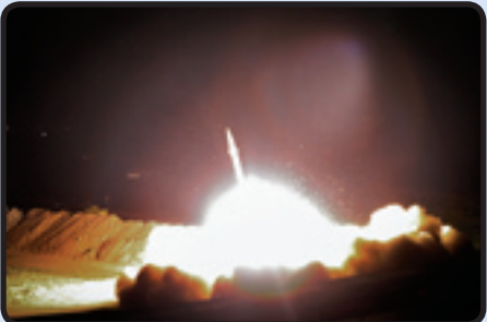
موشک ذوالفقار در عملیات لیل‌القدر