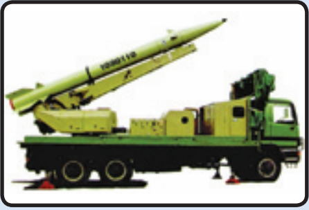
فاتح ۱۱۰ و پرتابگر تکی آن