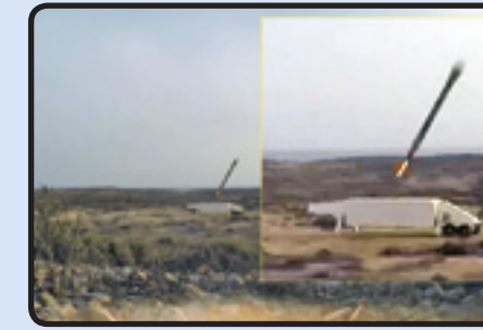
انهدام ماکت رادار امریکایی در رزمایش پیامبر اعظم (ص) ۱۴