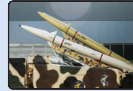
دو موشک ذوالفقار بصیر و ذوقول روی پرتابگر مشترک

همانطور که می‌دانیم، ناوهای هواپیما هرگز به تنهایی به مأموریت اعزام نمی‌شوند و در کنار آنها چندین فروند ناوشک موشک‌انداز، ناوهای لجستیکی و حتی زیر دریایی وجود دارد. ناوهای هواپیما به تنهایی از رشی حدود ۶ میلیارد دلار دارند و هزینه نگهداری آنها در سال بالغ بر ۲۰۰ میلیون دلار است و به اینها باید ارزش دهها فروند ناوگر، تسلیحات و مهمات موجود را نیز اضافه کرد، خدمه آموزش دیده و باتجربه نیز عملاً قابل قیمت گذاری نیستند، اما این پایگاه هوایی بزرگ و متحرک که روزگاری تهدید عظیمی به حساب می‌آمد، امروز به سادگی مورد تهدید موشک‌های بالستیک پرسرعت تاکتیکی و میانبرد و حتی دوربرد ایرانی قرار گرفته است.