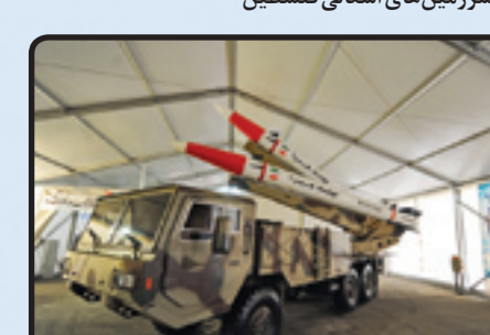
موشک‌های هرمز - ۱ و ۲ در نمایشگاه نیروی هوافضای سپاه در سال ۱۳۹۳