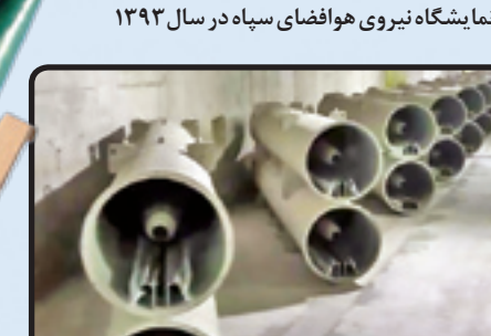
موشک‌های فاتح در پرتابگر استوانه‌ای در شهر موشکی نیروی دریایی سپاه