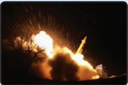
شلیک موشک فاتح ۳۱۳ معروف به فاتح F در عملیات انتقام شهادت سپهبد حاج قاسم سلیمانی