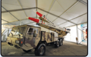
موشک‌های هرمز - ۲۰