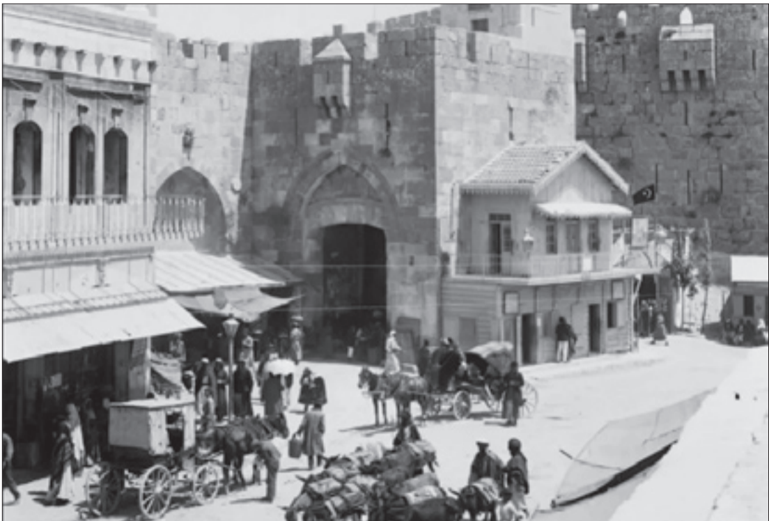
عکس از بیت‌المقدس سال ۱۹۱۰ در زمان حکومت عثمانی