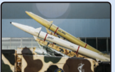
دو موشک ذوالفقار بصیر و دزفول روی پر تابگر مشترک

در همین ۱۳۹۸ موشک رعد ۵۰ که با فناوری‌های سوخت جامد جدید و بدنه و عایق موثر ساخته شده از مواد ترکیبی (کامپوزیت) غیر فلزی ساخته شده بود شگفتی جدید سپاه در زمینه موشک‌های تاکتیکی بود، البته ذکر این نکته ضروری است که رعد ۵۰ با وجود بهره بردن از تجربیات فاتح ۱۱۰ و طراحی در همان رده و مأموریت دیگر نمی‌توان مستقیماً از اعضای خانواده فاتح به شمار آورد، زیرا طراحی آن در بخش‌های مختلف متفاوت با طراحی مرسوم فاتح و مشتقات آن است، از جمله سرچنگی و بالک‌های کنترلی متفاوت با نسل فاتح. این سلاح با وزن کمی بیش از نصف فاتح ۱۱۰ بردی معادل آن را دارد. همچنین موشک شهید سلیمانی هم که سوخت جامد و تاکتیکی با برد هزار ۴۰۰ کیلومتر است، با وجود استفاده از همان سرچنگی موشک ذوالفقار اما یک طراحی جدید محسوب می‌شود و از خانواده فاتح ۱۱۰ محسوب نمی‌شود. این موشک دارای بدنه‌ای با قطر بیشتر و طراحی متفاوتی از موشک‌های قبلی خانواده فاتح است. خبیر شکن هم روی پر تابگرهای تکی و هم دو تایی عملیاتی شده است و سیاه را قادر می‌سازد تا قلعه خبیر شکل گرفته در شرق دریای مدیترانه، احتی از عمق چندصد کیلومتری داخل خاک ایران در هم بکند.