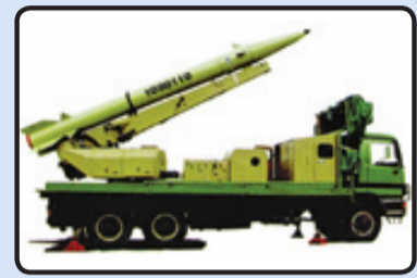
فاتح ۱۱۰ و پر تابگر تکی آن

برای مقایسه راکت فجر ۵ در مدل پایه خود با جرم حدود ۹۰۷ کیلوگرم و طول بیشتر از ۶/۴ متر و قطر ۳۳۳ میلی‌متر به برد ۷۵ کیلومتر می‌رسد. نمونه برد بلند و هدایت‌شونده آن هم با برد ۱۵۰ کیلومتر و ۹۲۰ کیلوگرم جرم و طول بیشتر از ۶/۴ متر و ۳۸ کیلوگرم سرچنگی کمتر نسبت به فاتح دارد. یک ویژگی مهم دیگر موشک فاتح پر تابگر شش تایی آن است در