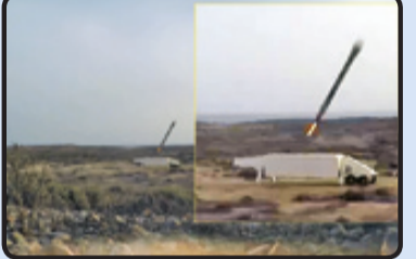
انهدام ماکت رادار امریکایی در رزمایش پیامبر اعظم (ص) ۱۴