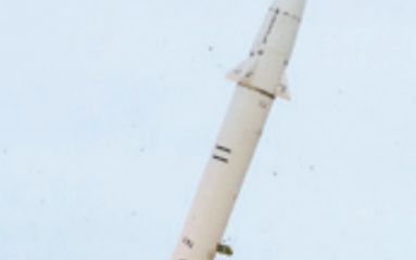
اصابت بسیار دقیق موشک هرمز - ۱ به رادار