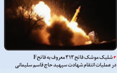
موشک‌های موشکی ایران