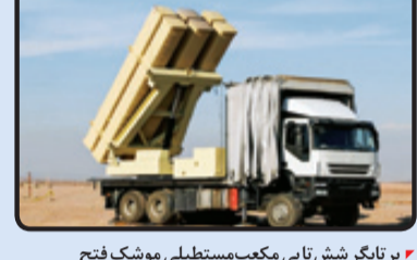
پر تابگر شش تایی مکعب مستطیلی موشک فاتح