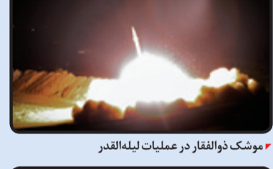
موشک ذوالفقار در عملیات لبه‌القدر