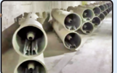
موشک‌های فاتح در پر تابگر استوانه‌ای در شهر موشکی نیروی دریایی سپاه