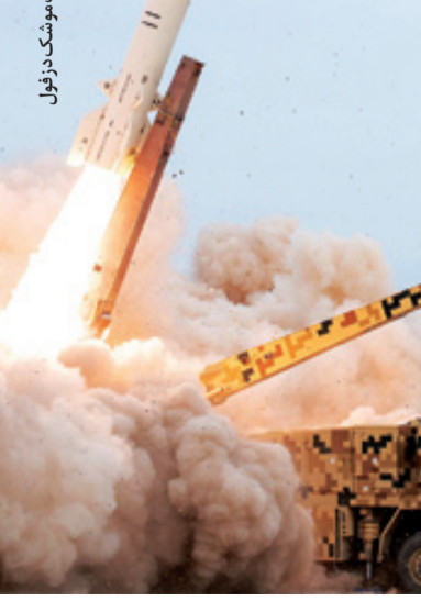
شلیک موشک دزفول