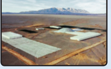
تصویری از ماکت ساخته شده از هدف موجود در سرزمین‌های اشغالی فلسطین