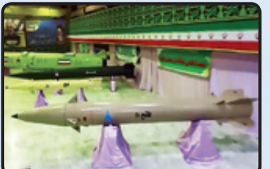
مقایسه ابعاد موشک فاتح با فاتح و راکت زلزلال

نسل‌های جدید بالستیک‌های بومی ایران در بهمن ۱۳۹۸ موشک رعد ۵۰ که با فناوری‌های سوخت جامد جدید و بدنه و عایق موثر ساخته شده از مواد ترکیبی (کامپوزیت) غیر فلزی ساخته شده بود شگفتی جدید سپاه در زمینه موشک‌های تاکتیکی بود، البته ذکر این نکته ضروری است که رعد ۵۰ با وجود بهره بردن از تجربیات فاتح ۱۱۰ و طراحی در همان رده و مأموریت دیگر نمی‌توان مستقیماً از اعضای خانواده فاتح به شمار آورد، زیرا طراحی آن در بخش‌های مختلف متفاوت با طراحی مرسوم فاتح و مشتقات آن است، از جمله سرچنگی و بالک‌های کنترلی متفاوت با نسل فاتح. این سلاح با وزن کمی بیش از نصف فاتح ۱۱۰ بردی معادل آن را دارد. همچنین موشک شهید سلیمانی هم که سوخت جامد و تاکتیکی با برد هزار ۴۰۰ کیلومتر است، با وجود استفاده از همان سرچنگی موشک ذوالفقار اما یک طراحی جدید محسوب می‌شود و از خانواده فاتح ۱۱۰ محسوب نمی‌شود. این موشک دارای بدنه‌ای با قطر بیشتر و طراحی متفاوتی از موشک‌های قبلی خانواده فاتح است. خبیر شکن هم روی پر تابگرهای تکی و هم دو تایی عملیاتی شده است و سیاه را قادر می‌سازد تا قلعه خبیر شکل گرفته در شرق دریای مدیترانه، احتی از عمق چندصد کیلومتری داخل خاک ایران در هم بکند.