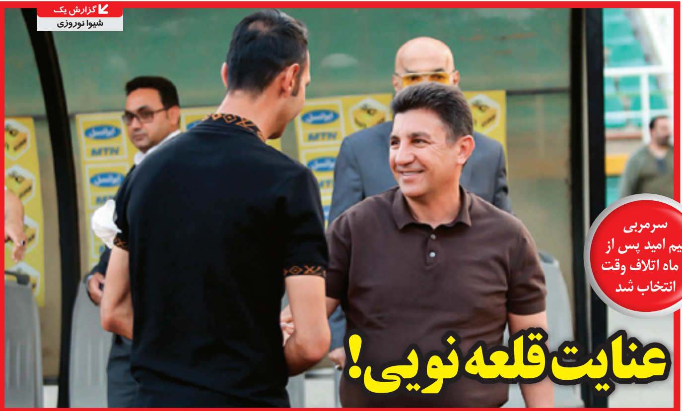
گزارش یک شنبوا نوزری

انتخاب سرمربی جدید و اتمام لیگ کار را به جای رساند که کاروان ورزش ایران در هانگژو برای روشن شدن تکلیف امیدها لحظه شماری کند. دبیر کل کمیته ملی المپیک چند باری به فدراسیون اخطار داده و حتی حمید سجادی نیز تلاش کرد با اولتیماتوم دادن به مردم شانه خالی کرده