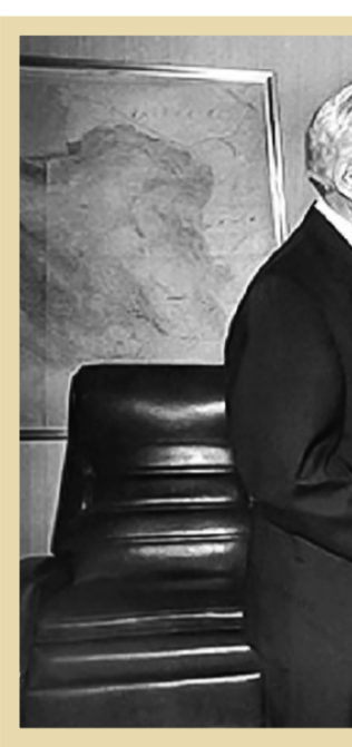
ویشام سولیوان در دیدار با مهدی بازرگان ۱۳۵۷