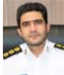
سرهنگ احسان مومنی معاون عملیات پلیس راهور تهران بزرگ